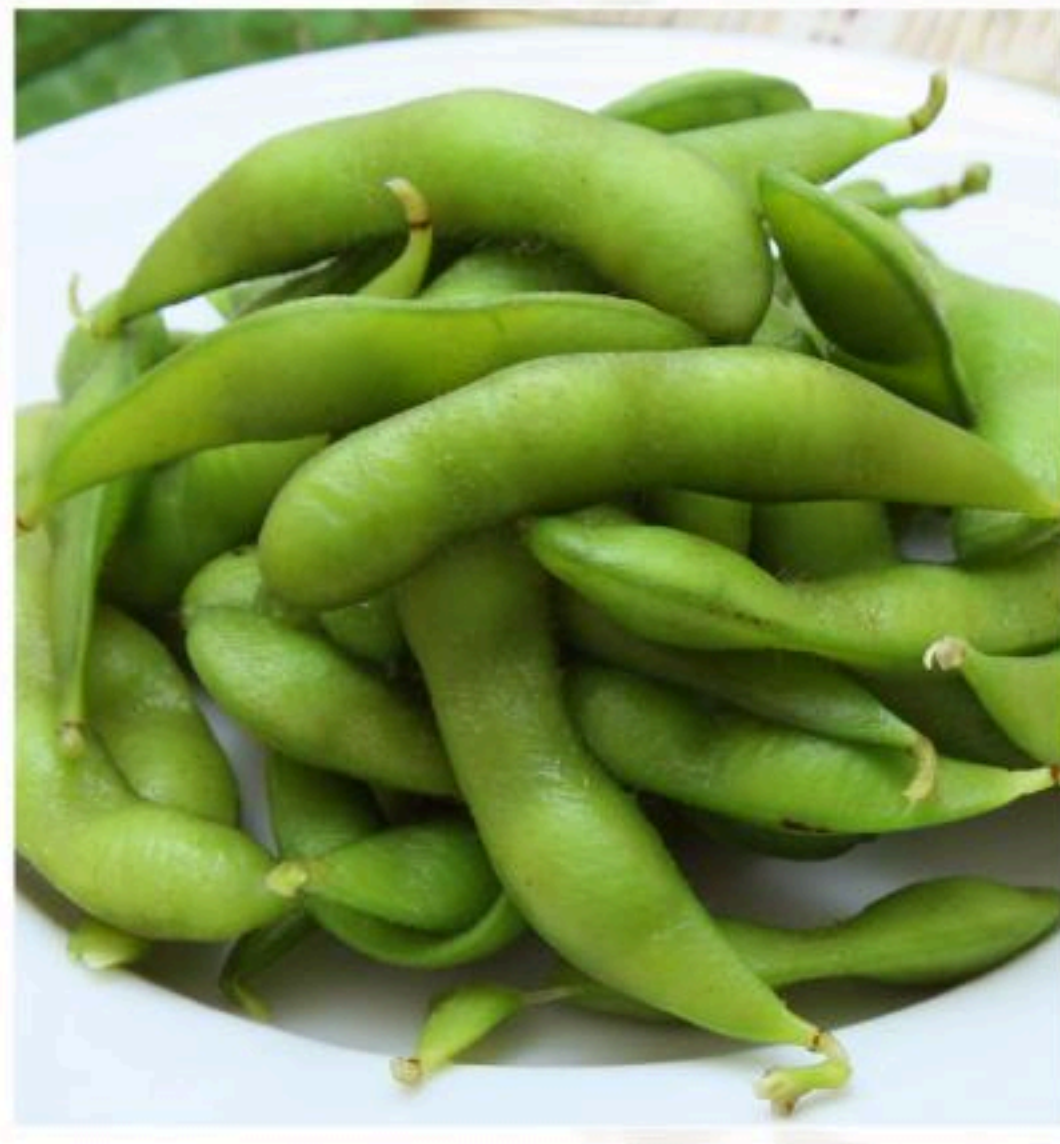
6. 枝豆 枝豆 400円