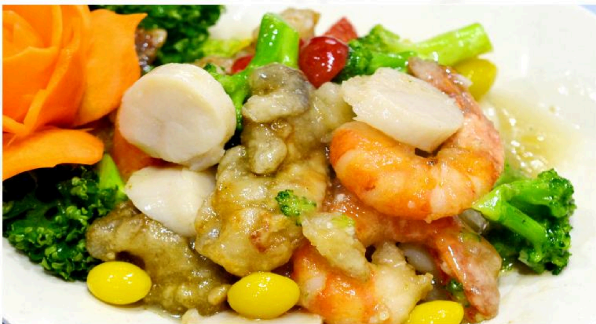
61.カキと車海老、大貝柱炒め 牡蠣三鮮 1,180円