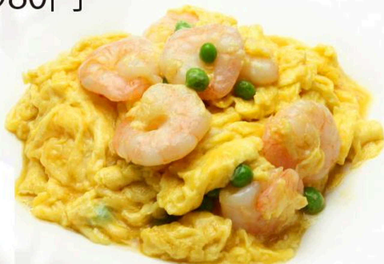
21. エビと玉子炒め 蝦仁炒蛋 880円