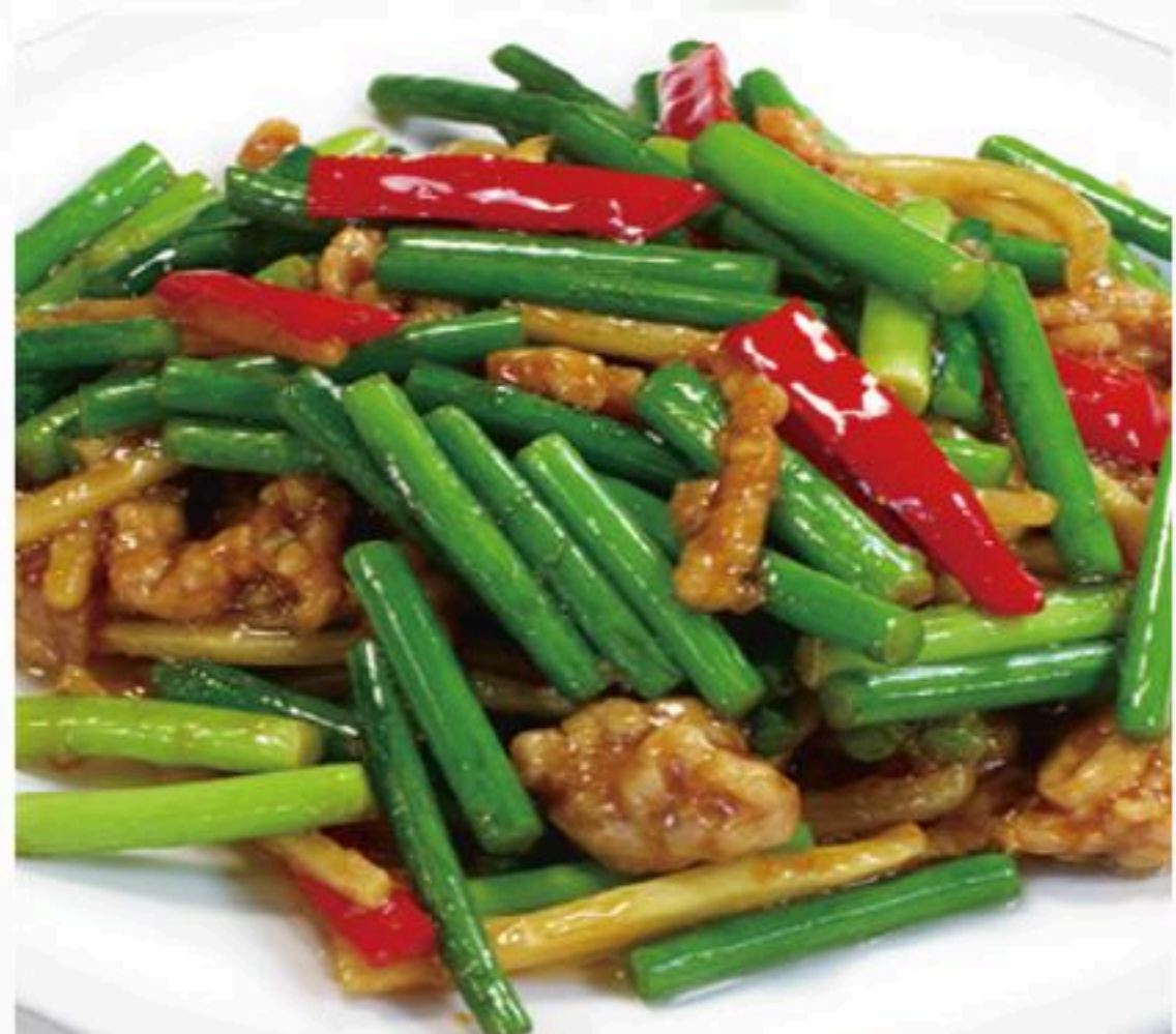
49.豚肉とニンニクの 芽炒め 蒜苗肉絲 880円