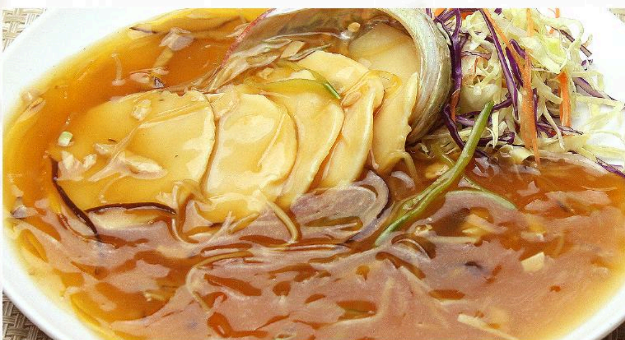
70.あわびとフカヒレの盛り合わせ 魚翅鮑魚 1,680円