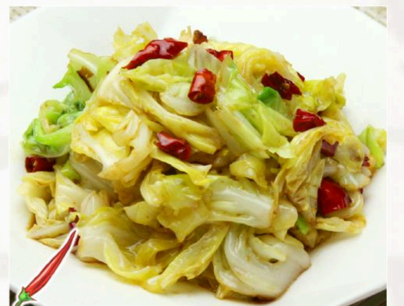
35. キャベツのピリ辛 炒め 辣炒包菜 800円