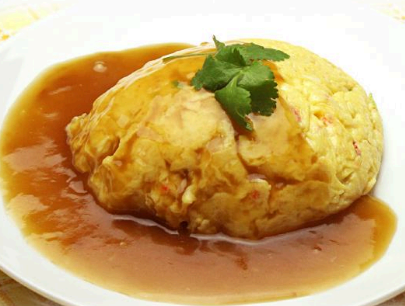
24. カニ玉 芙蓉蟹 980円