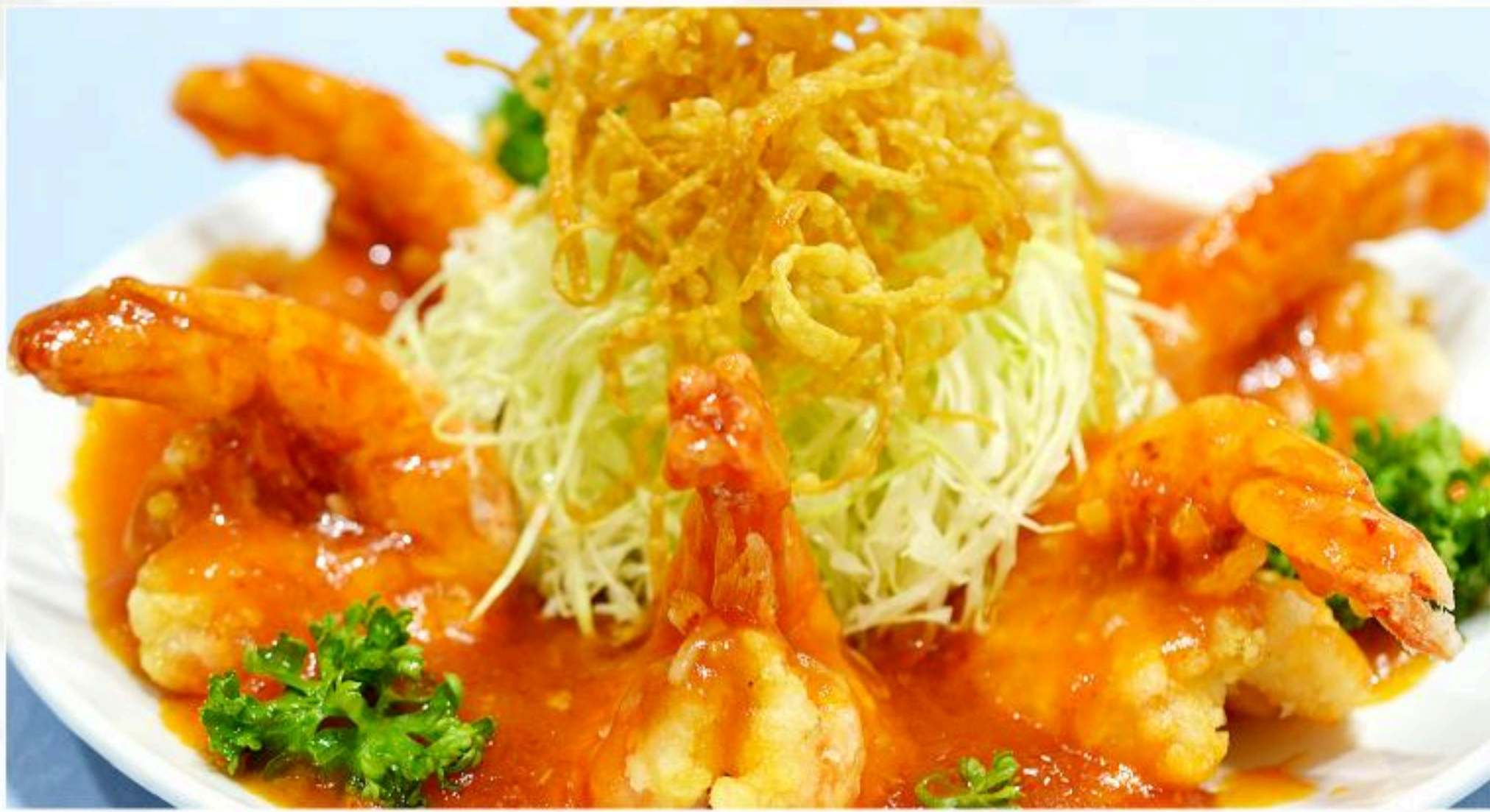
65.車エビのチリソース (6匹) 大正蝦球 1,180円