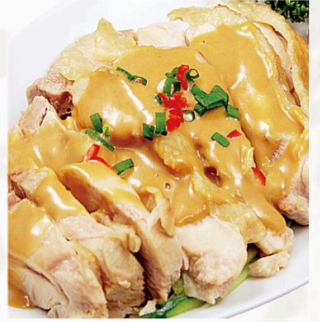
14. バンバンジー 棒棒鶏 500円