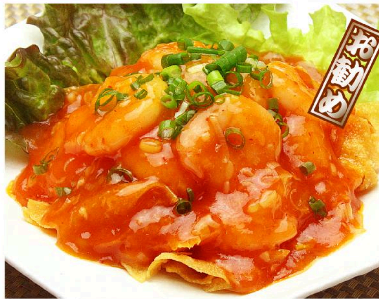
59.エビのチリソース炒め 干焼蝦仁 980円