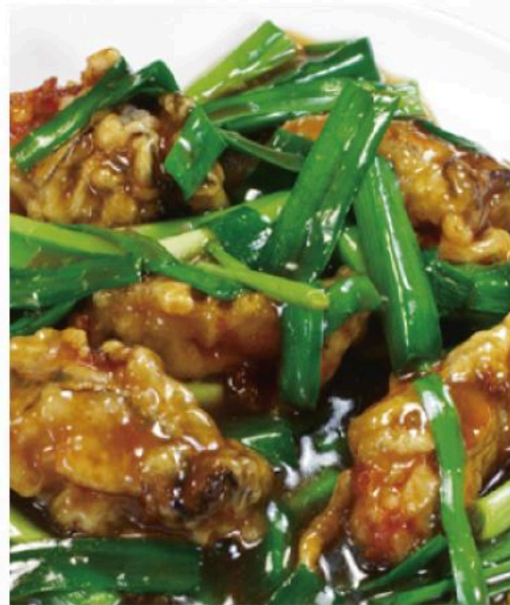
62.カキとニラの 黒胡椒炒め 韭菜牡蠣 980円