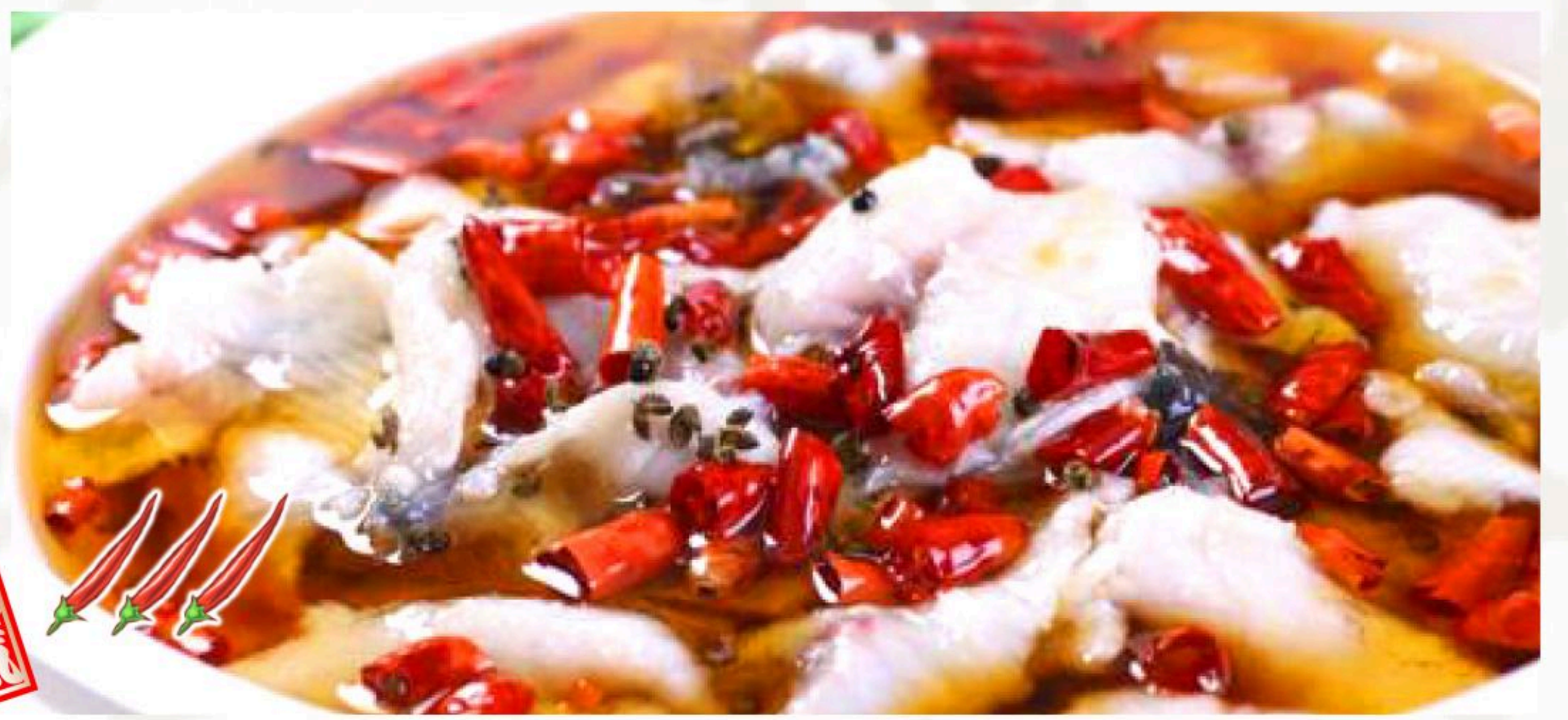
57.魚の激辛唐辛子煮込み 水煮魚 1,380円