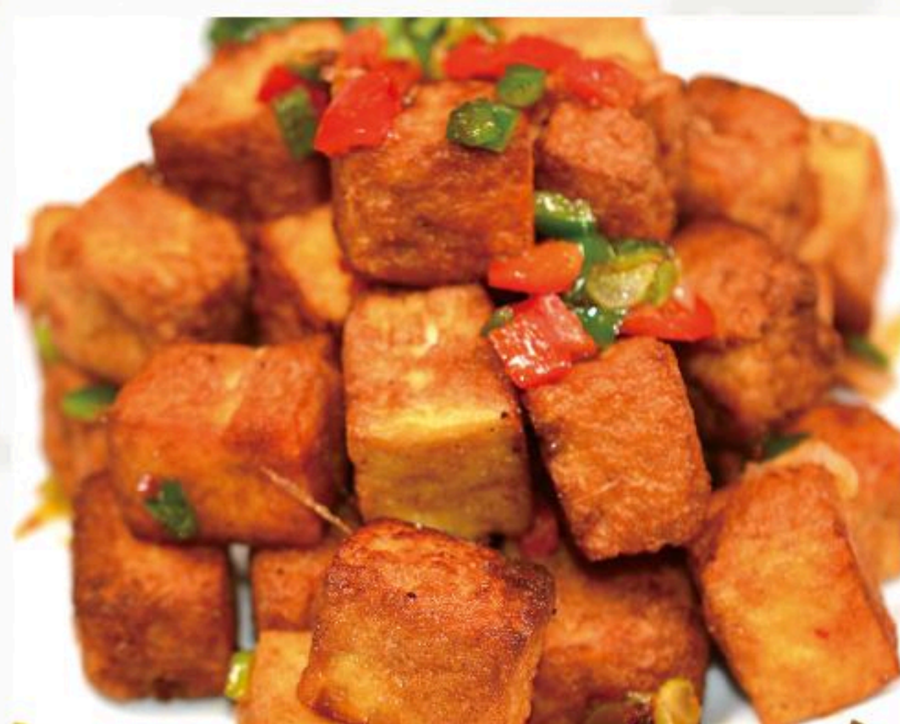
36. 塩胡椒揚げ豆腐 炸豆腐 680円