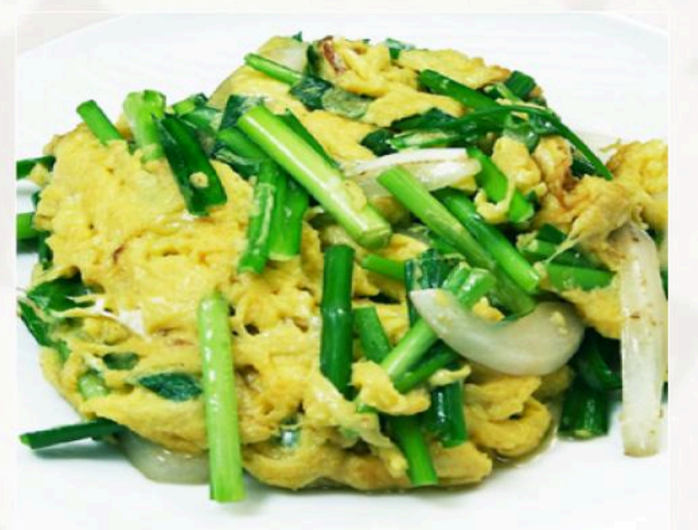
37. ニラと玉子炒め 韭菜炒蛋 780円