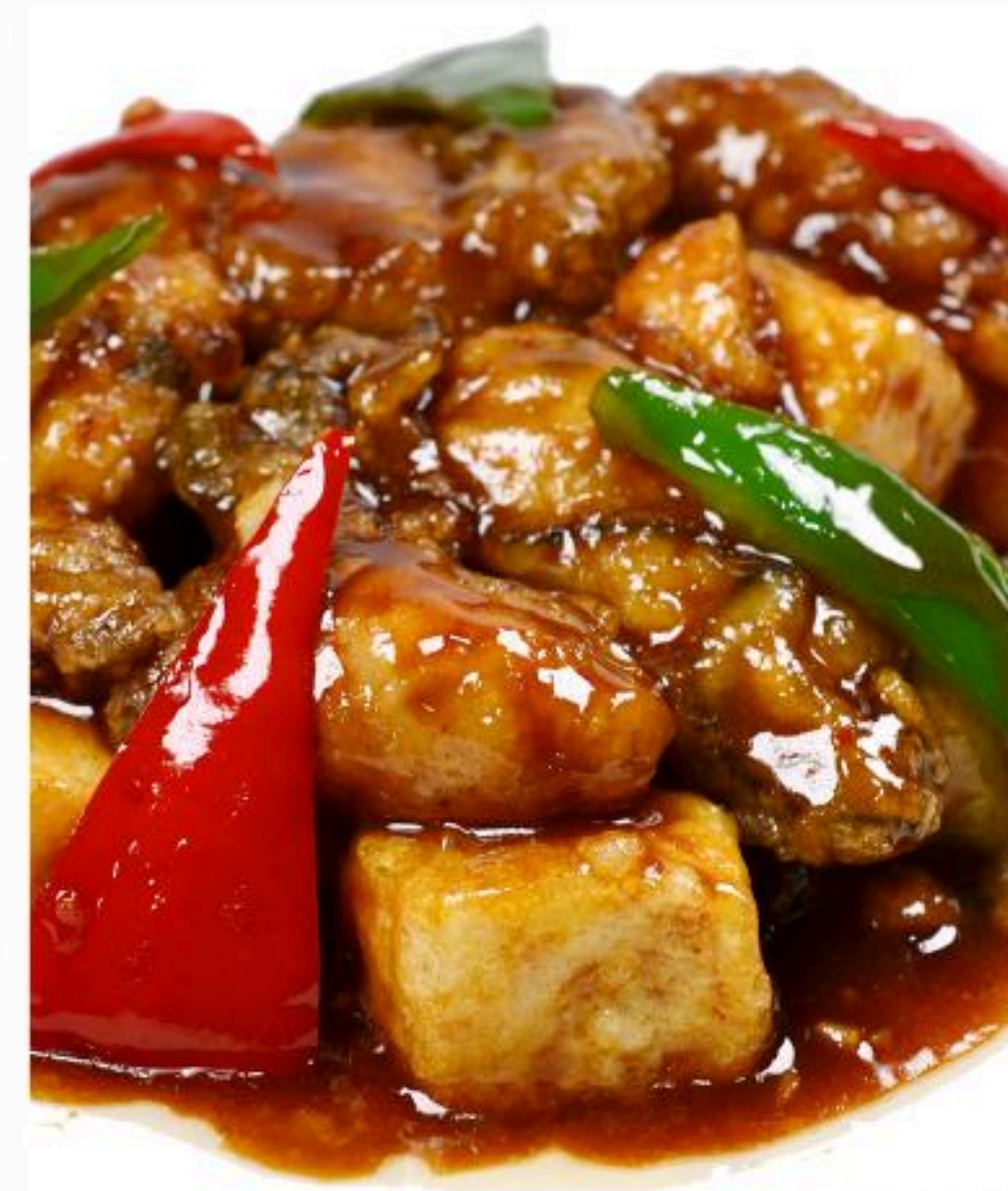
63.カキと厚揚げ 豆腐炒め 牡蠣豆腐 980円