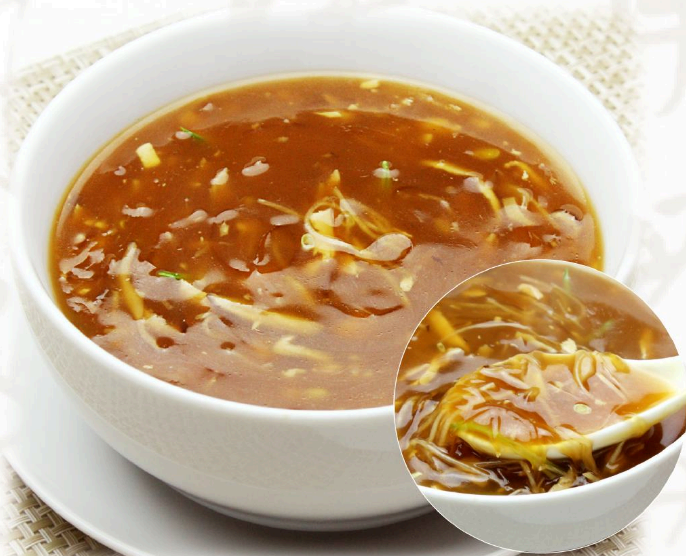
82.フカヒレスープ 三絲魚翅湯 1,080円