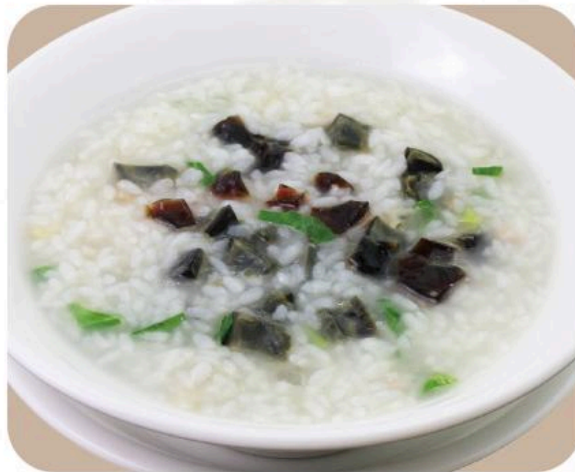
76.ピータン粥 皮蛋粥 680円