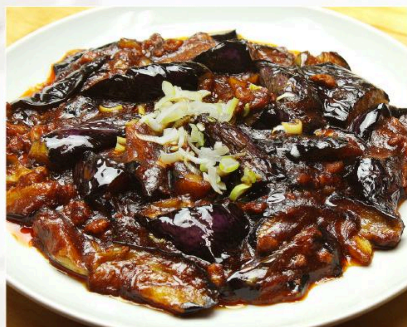
34. 豚挽肉と茄子の甘味噌 炒め 醬爆茄子 880円