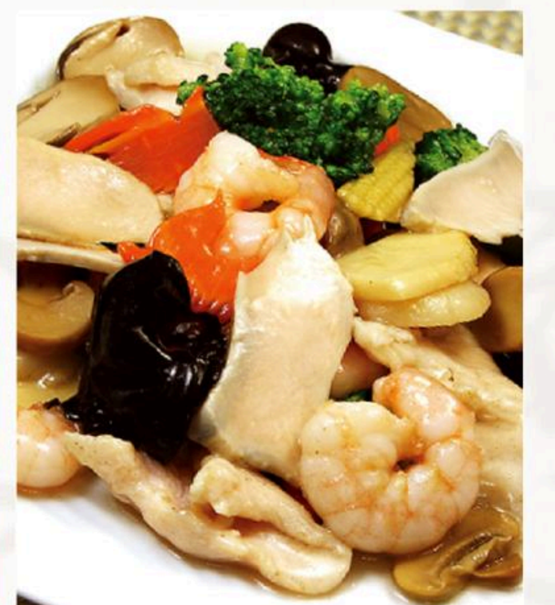
68.あわびとエビ、 鶏肉炒め 炒三鮮 1,280円