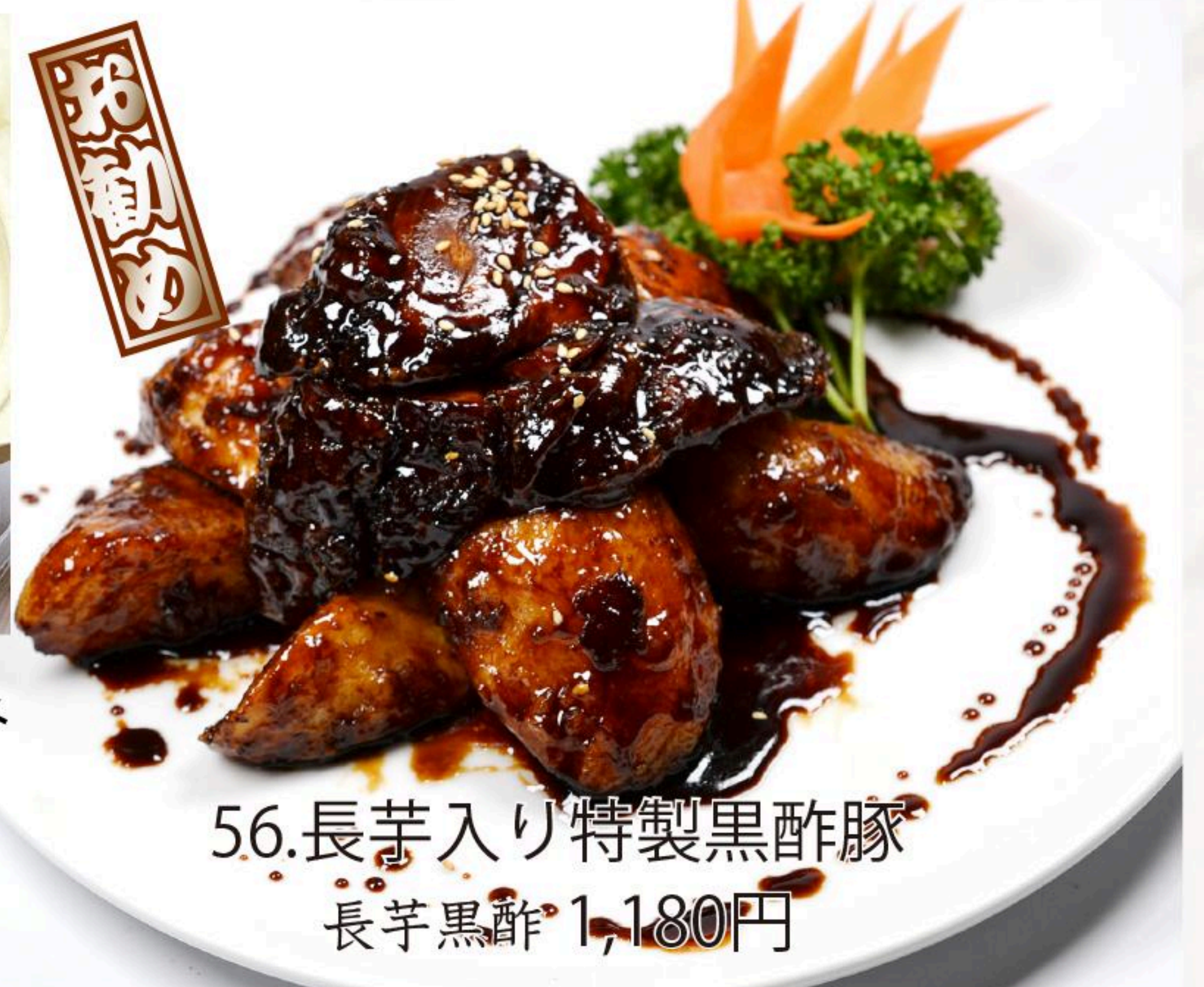
56.長芋入り特製黒酢豚 長芋黒酢 1,180円