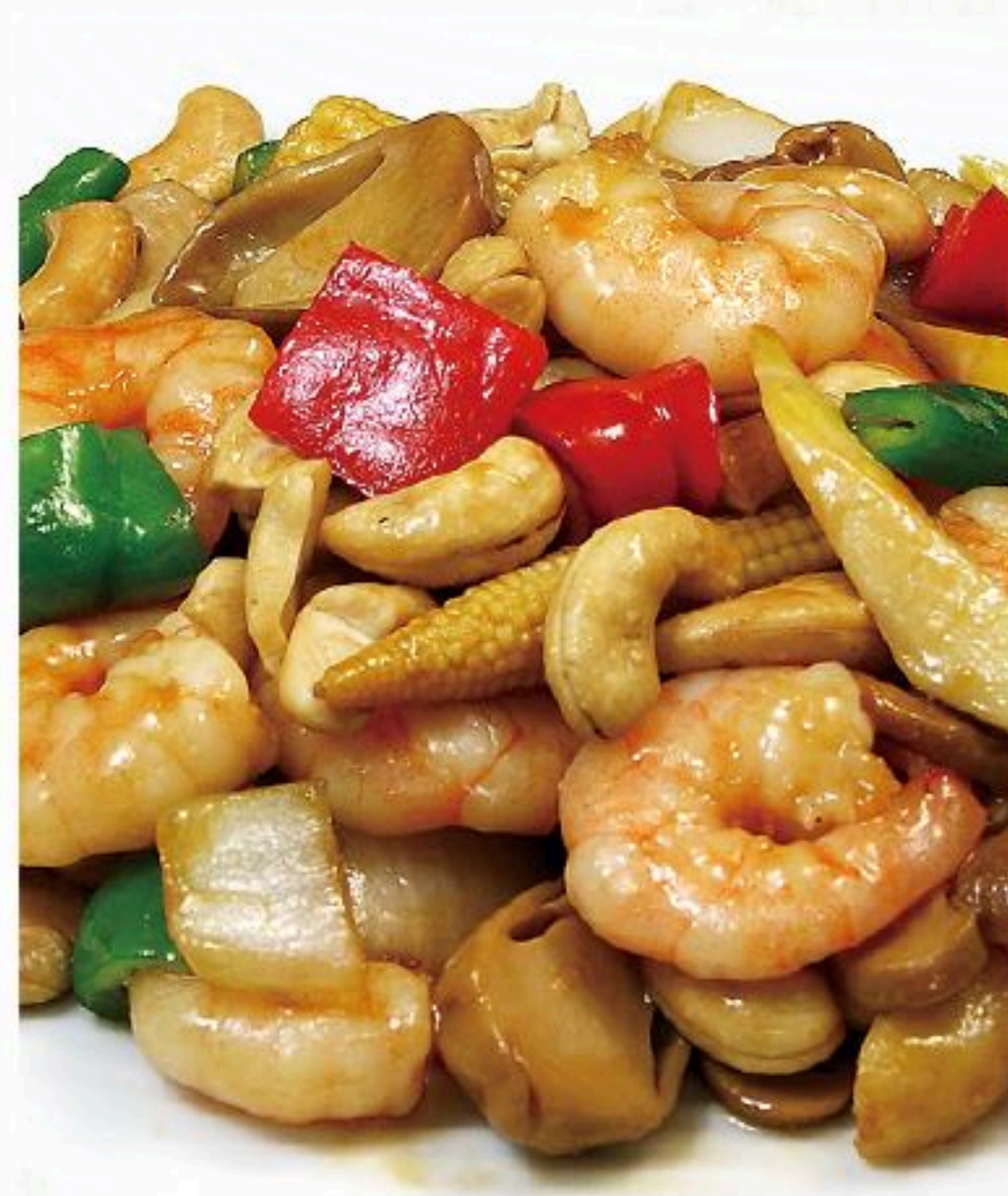
66.エビとカシュー ナッツ炒め 腰果蝦仁 980円