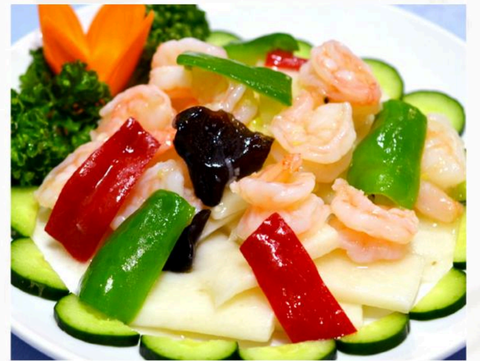
60.エビと長芋炒め 長芋蝦仁 980円