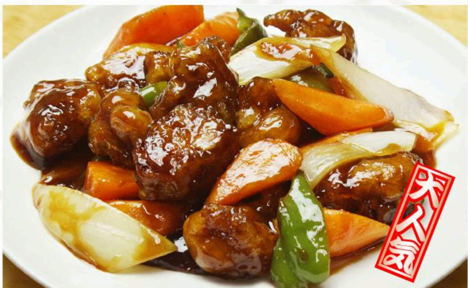
41.黒酢スブタ 黒酢古老肉880円