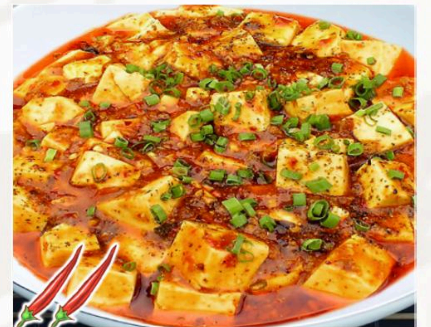
31. マーボー豆腐 麻婆豆腐(辛口/甘口) 780円