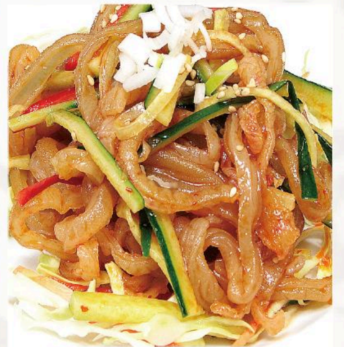
17. クラゲの冷菜 海蜇皮 700円