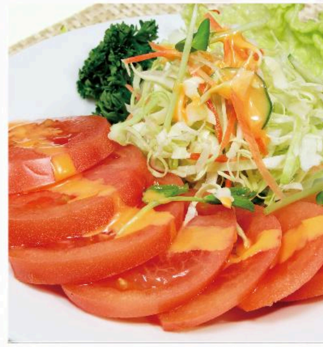
7. トマトサラダ 凉拌番茄 400円