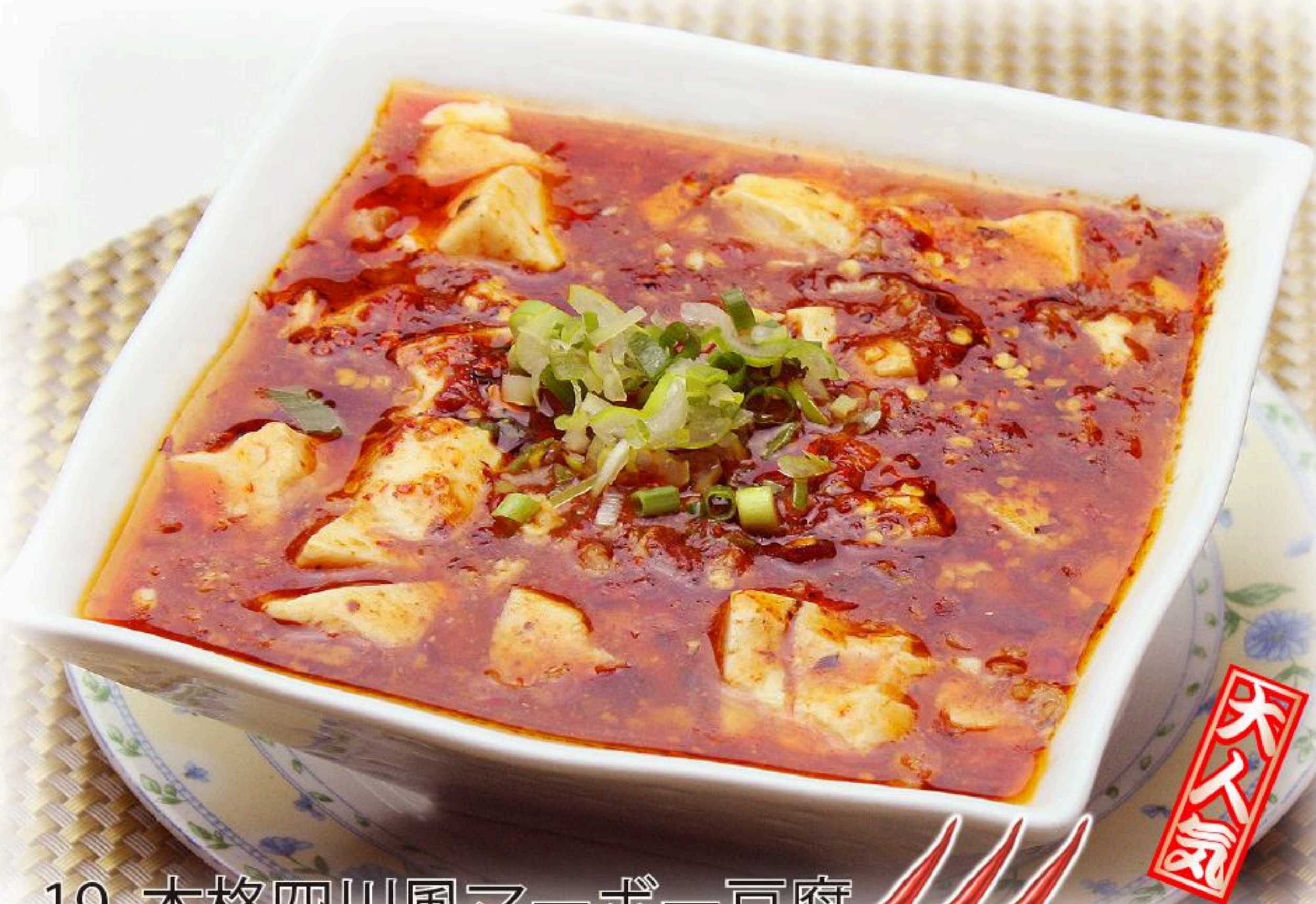
19. 本格四川風マーボー豆腐 四川風麻婆豆腐 980円