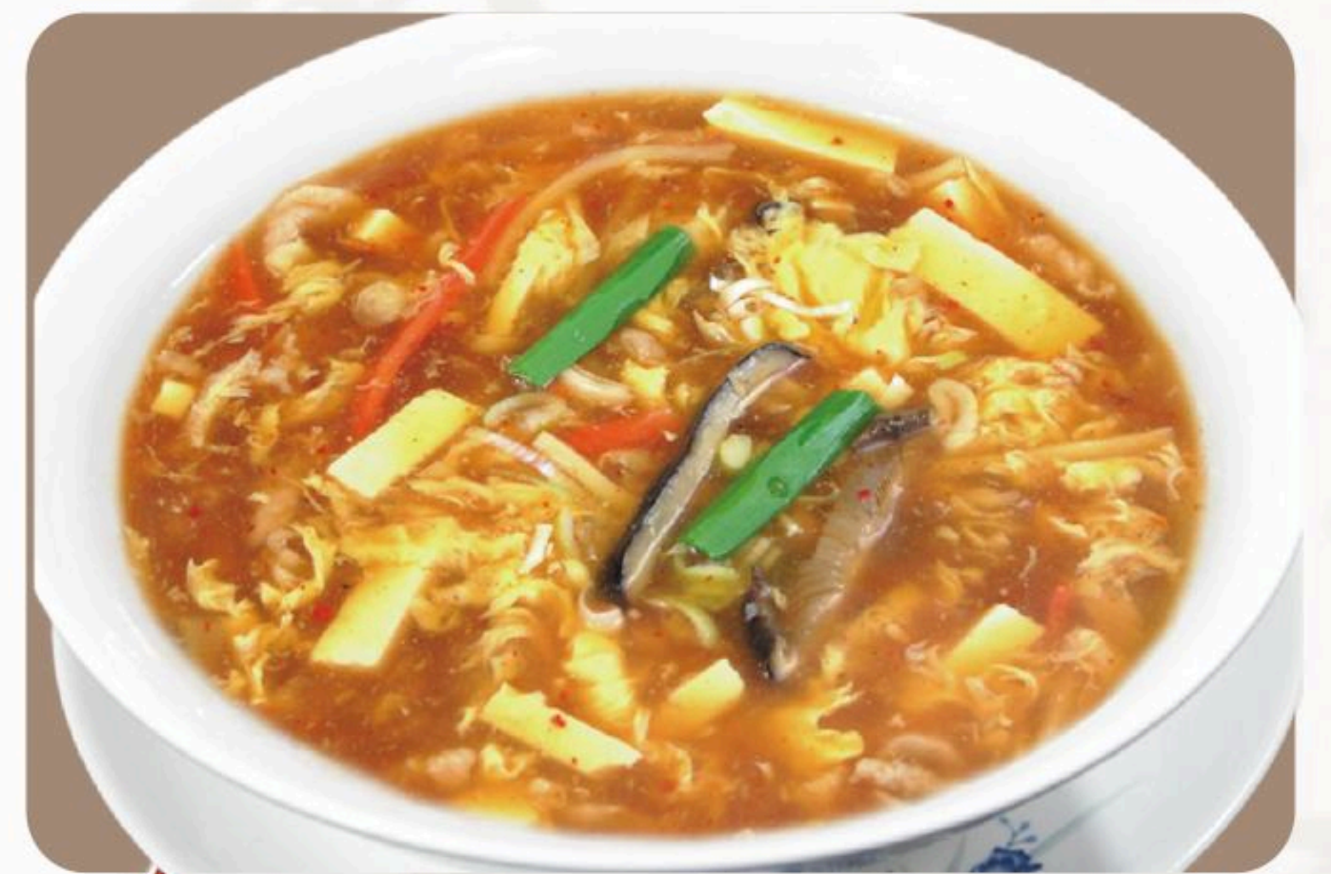
81.サンラータンスープ 辛酸湯 680円