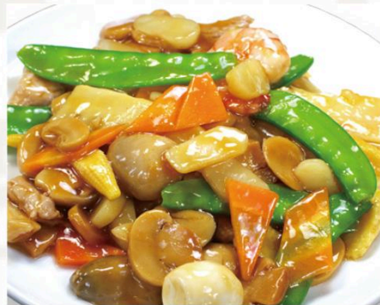
30. ハッポウサイ 八宝菜 980円