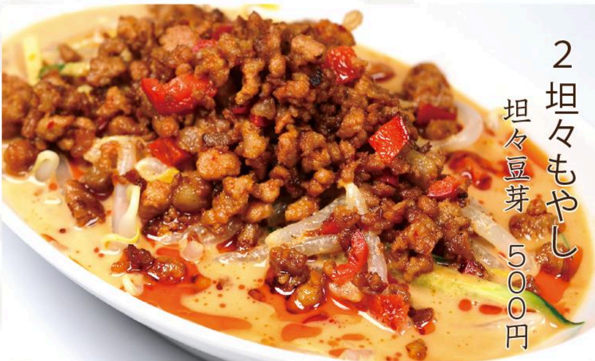
2 坦々もやし 坦々豆芽 500円