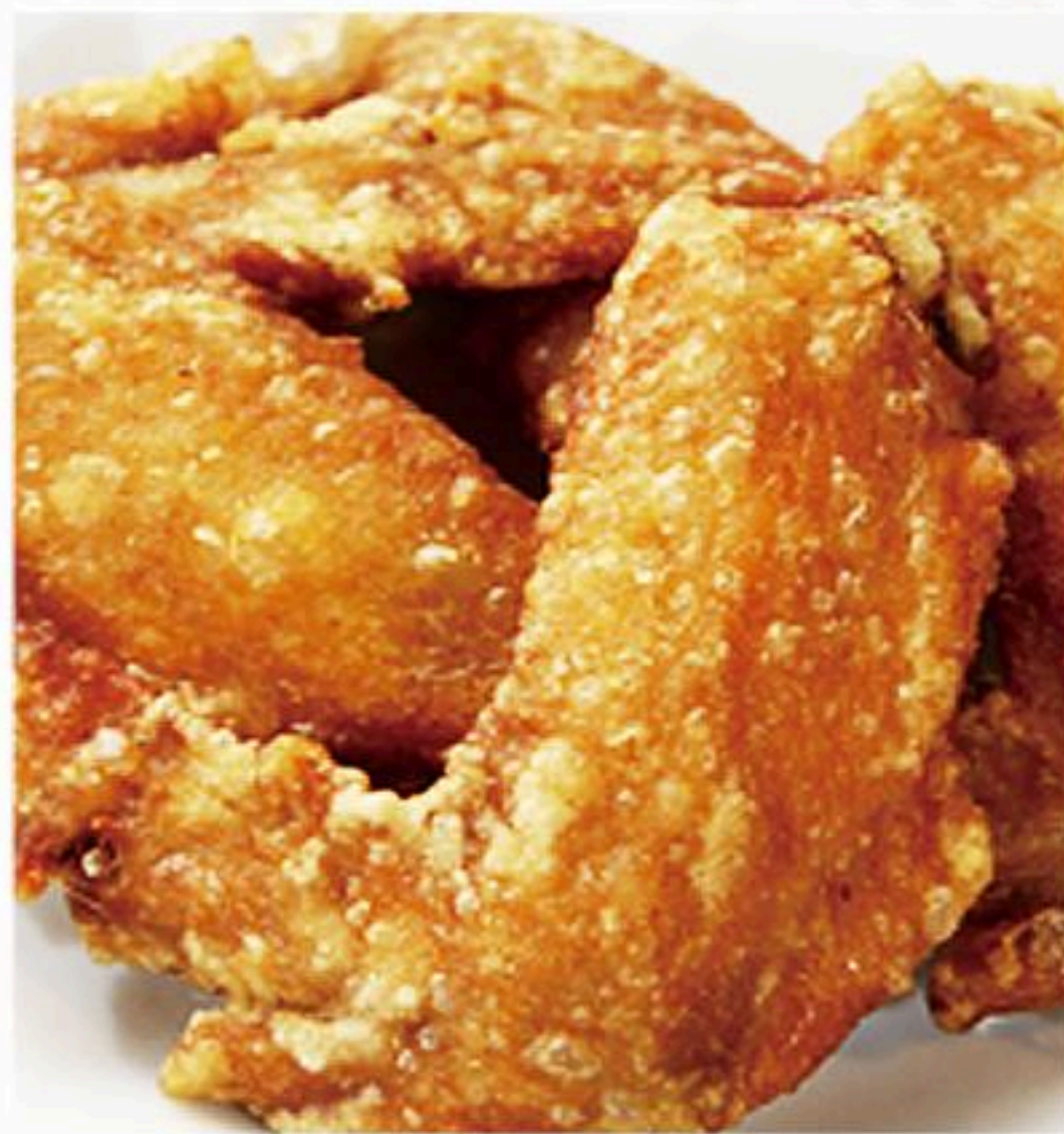
15. 手羽先唐揚げ (3本) 炸鸡翅 400円