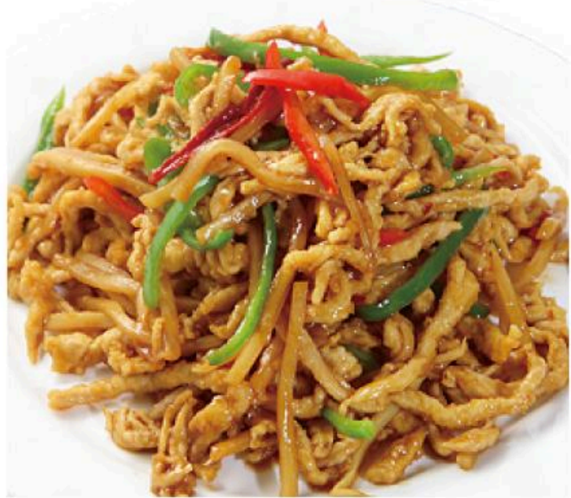
46.四川風チンジャオ ロース 魚香肉絲 880円