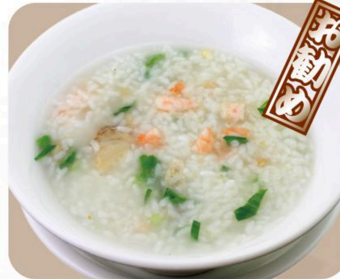
77.鶏肉粥 鶏肉粥 680円