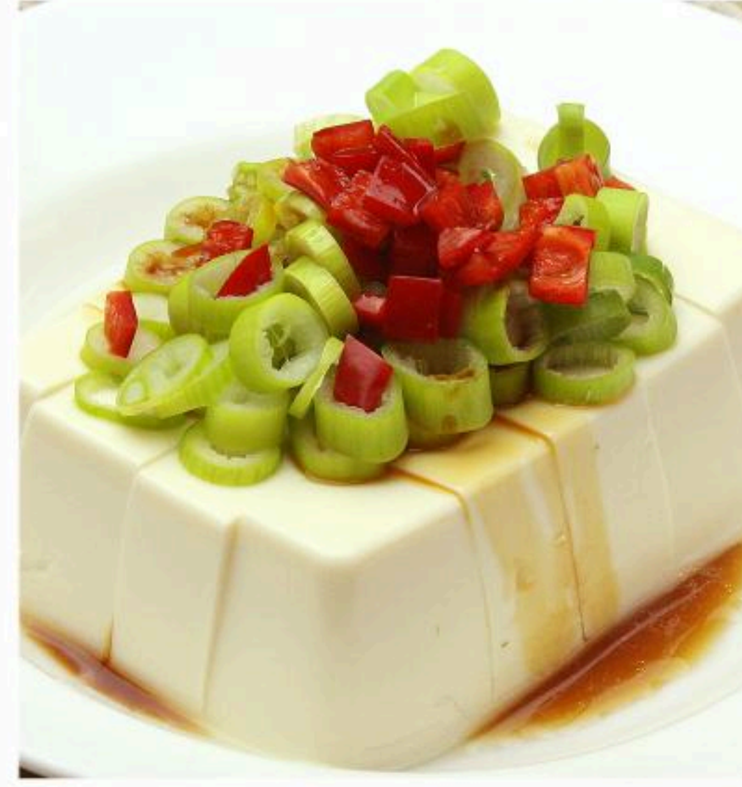
13. 冷やっこ 冷奴 400円