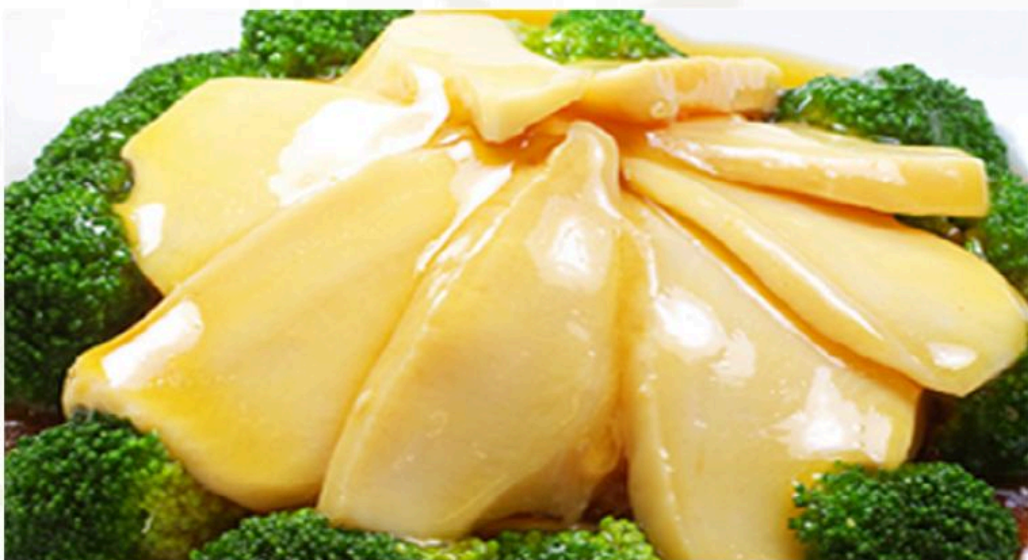
69.あわびの醤油煮込み 紅焼鮑魚 1,680円