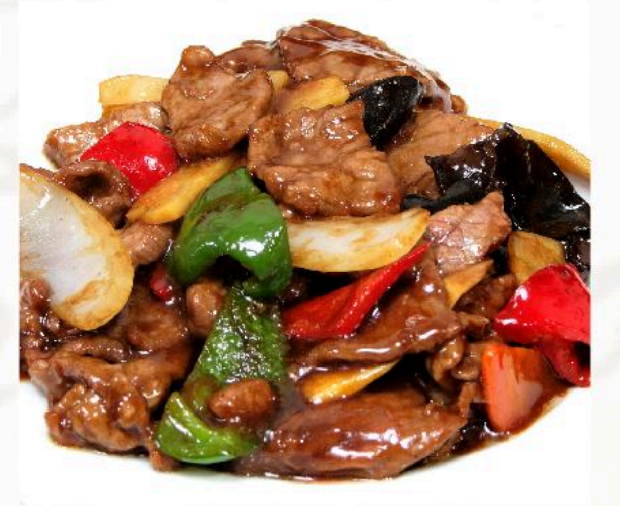
48.牛肉のオイスター ソース炒め 蚝油牛肉980円