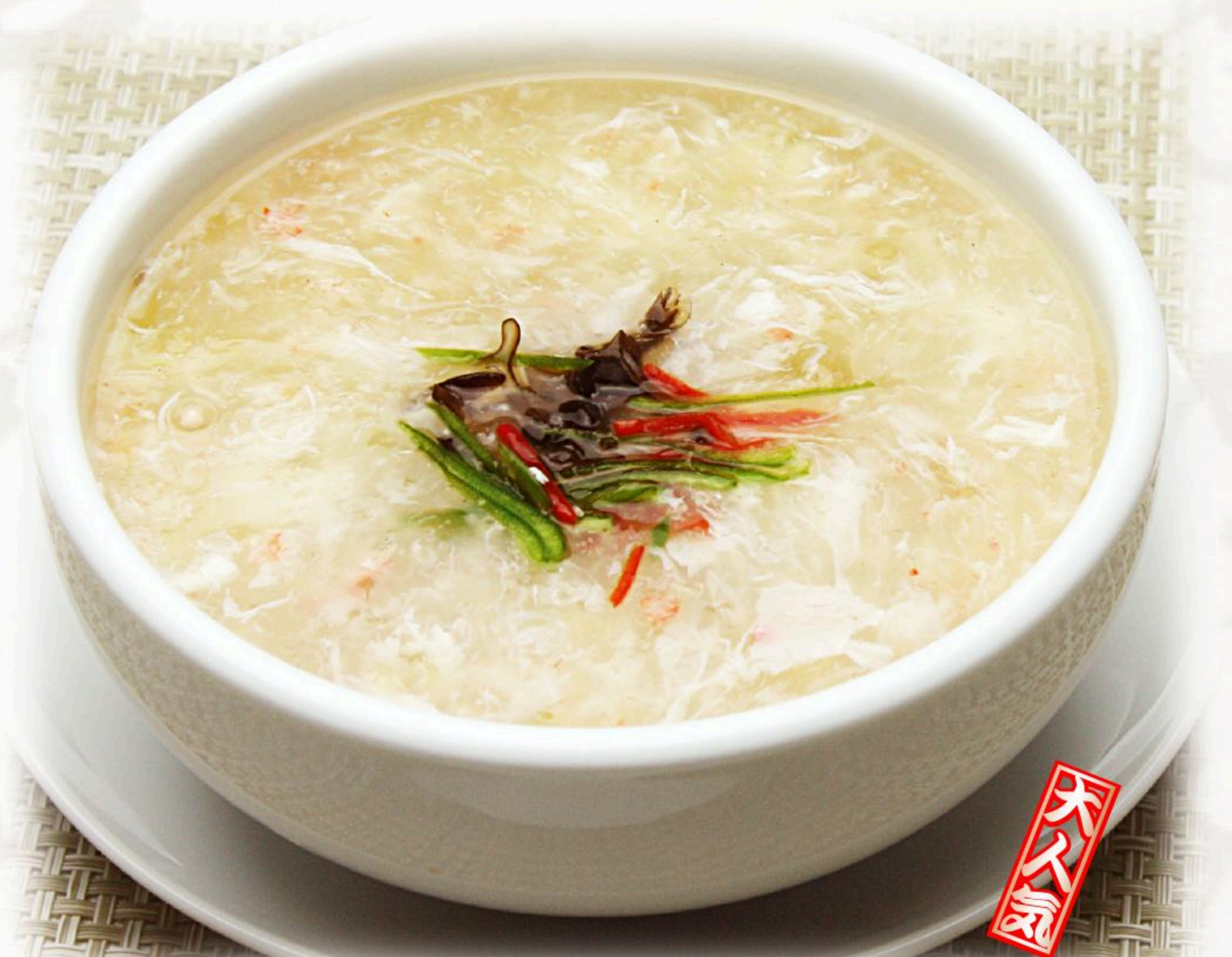
83.カニフカヒレスープ 蟹肉魚翅湯 1,180円