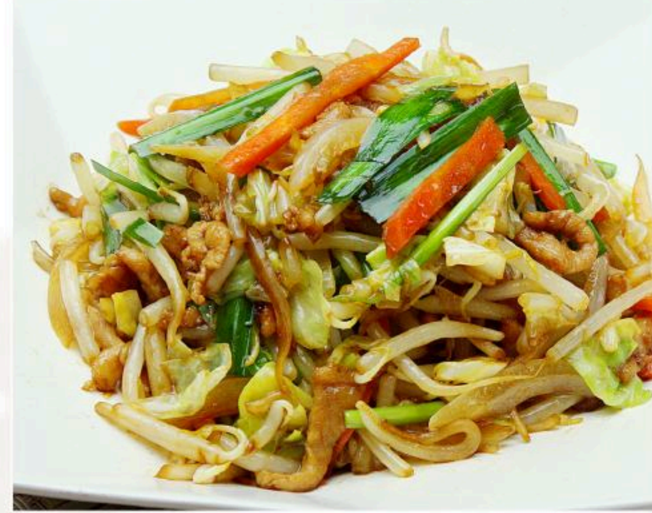
28. 肉野菜炒め 炒合菜 780円