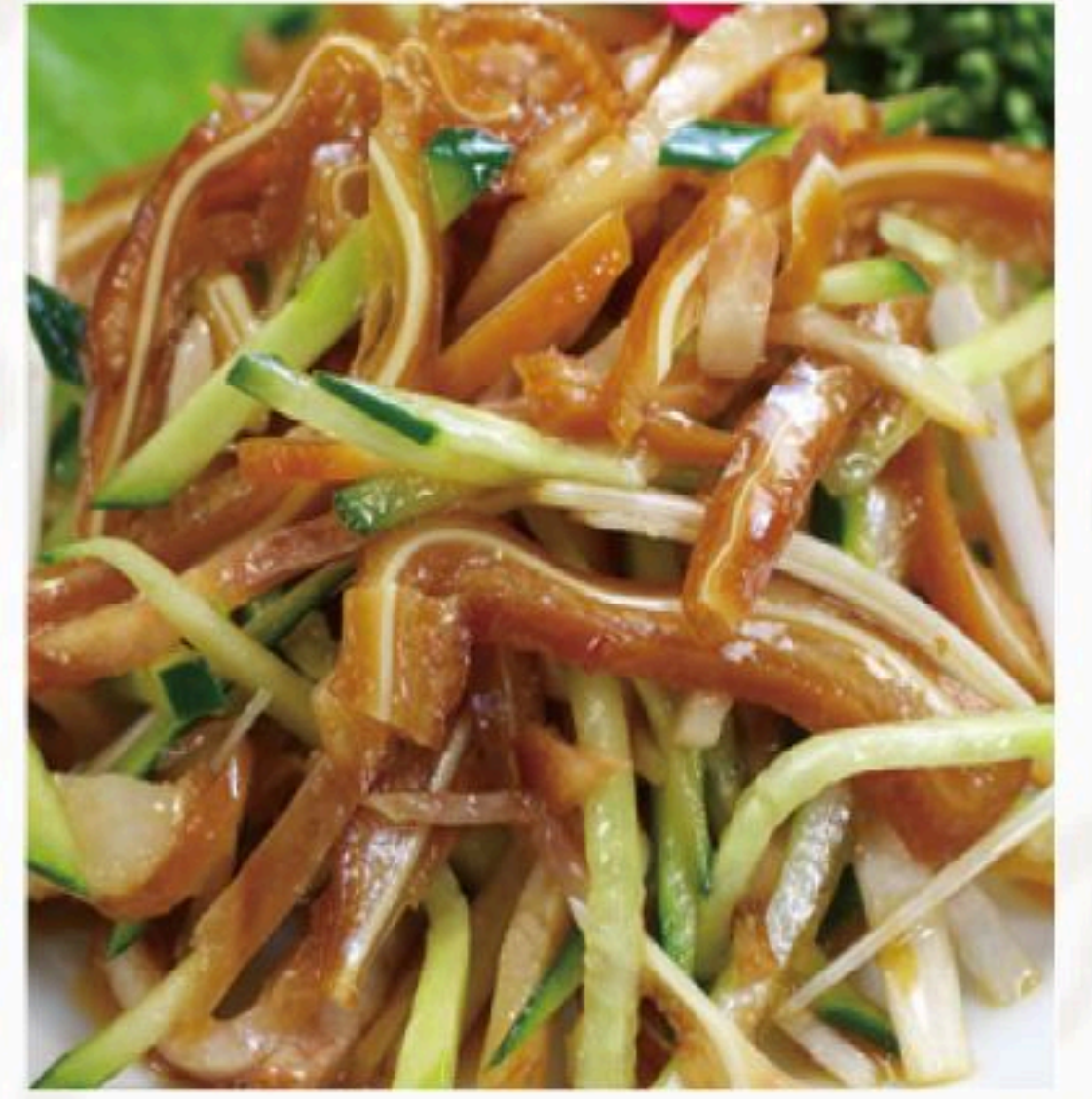
11. 豚耳の冷菜 拌豚耳 400円