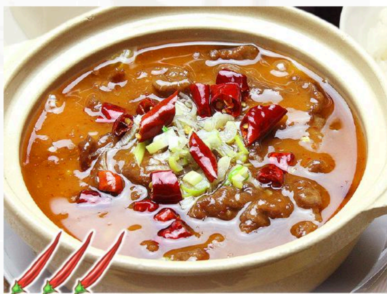
55.牛肉の激辛唐辛子煮込み 水煮牛肉 1,380円