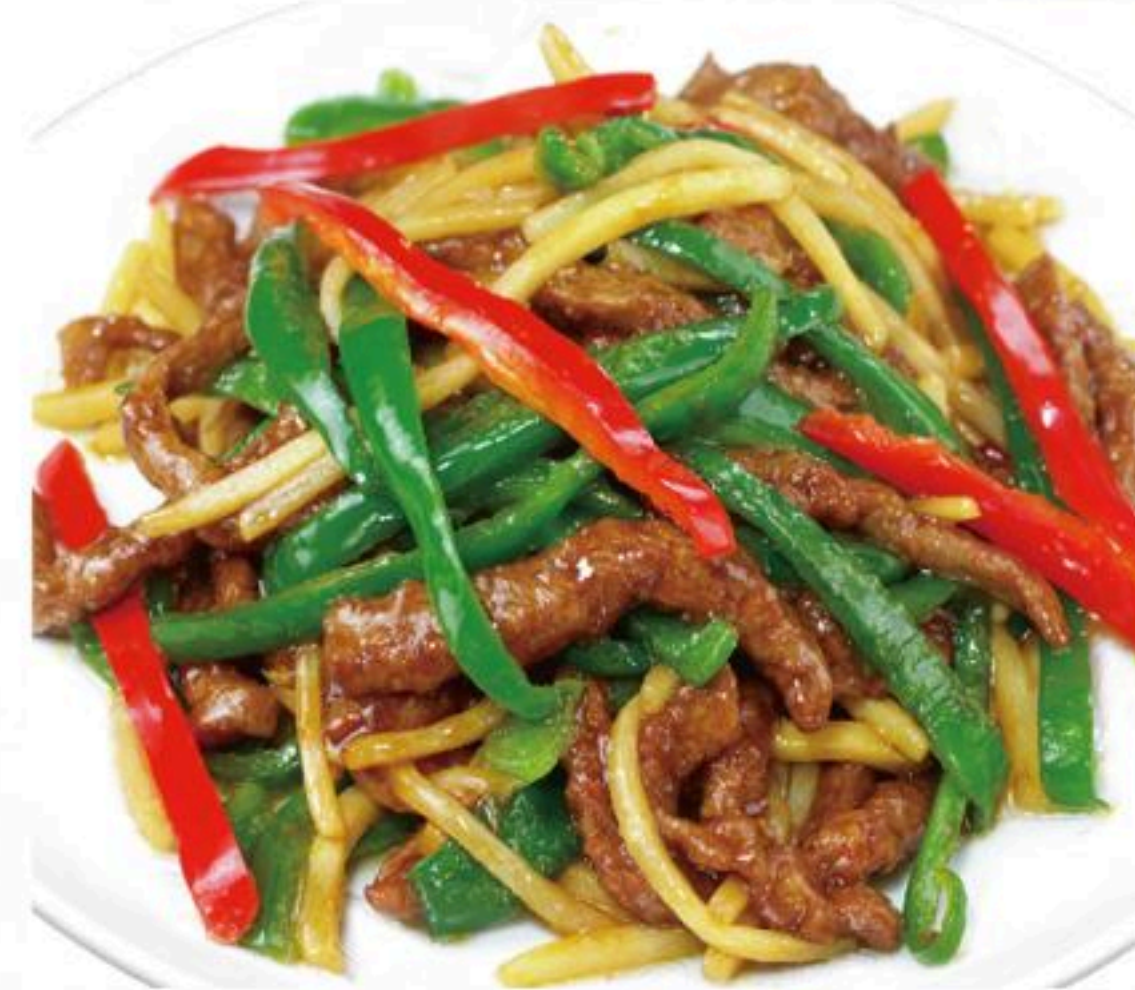
47.牛肉とピーマン の細切り炒め 青椒牛肉絲 980円