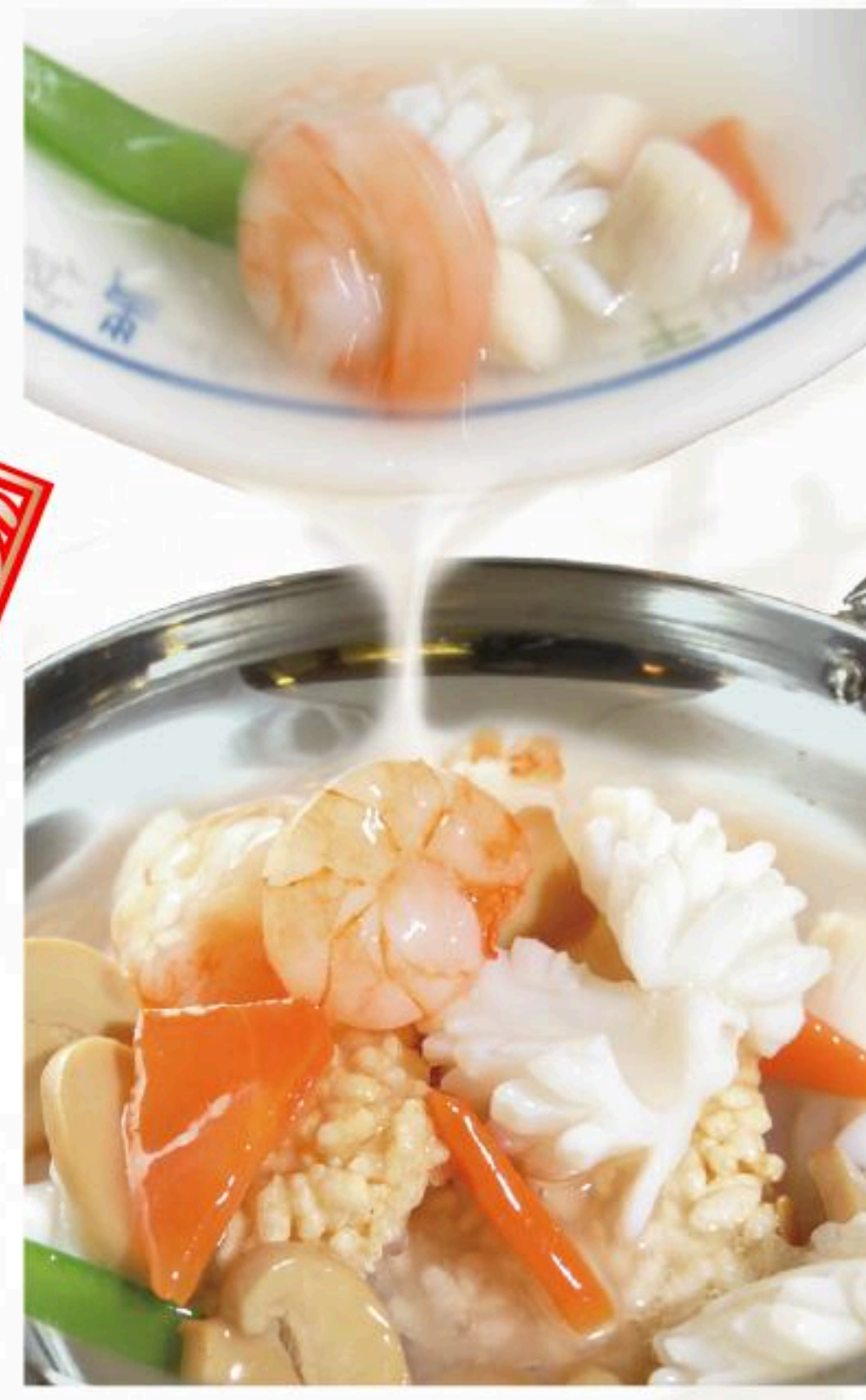
73.海鮮おこげ 海鮮鍋巴 1,180円