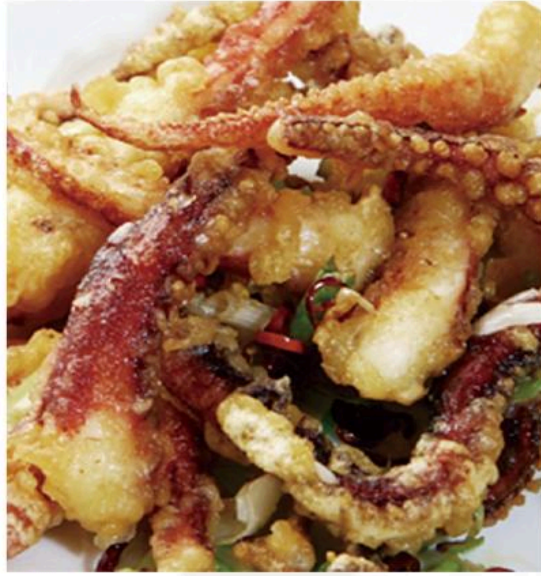
9. イカゲソの唐揚げ 炸鱿鱼须 500円