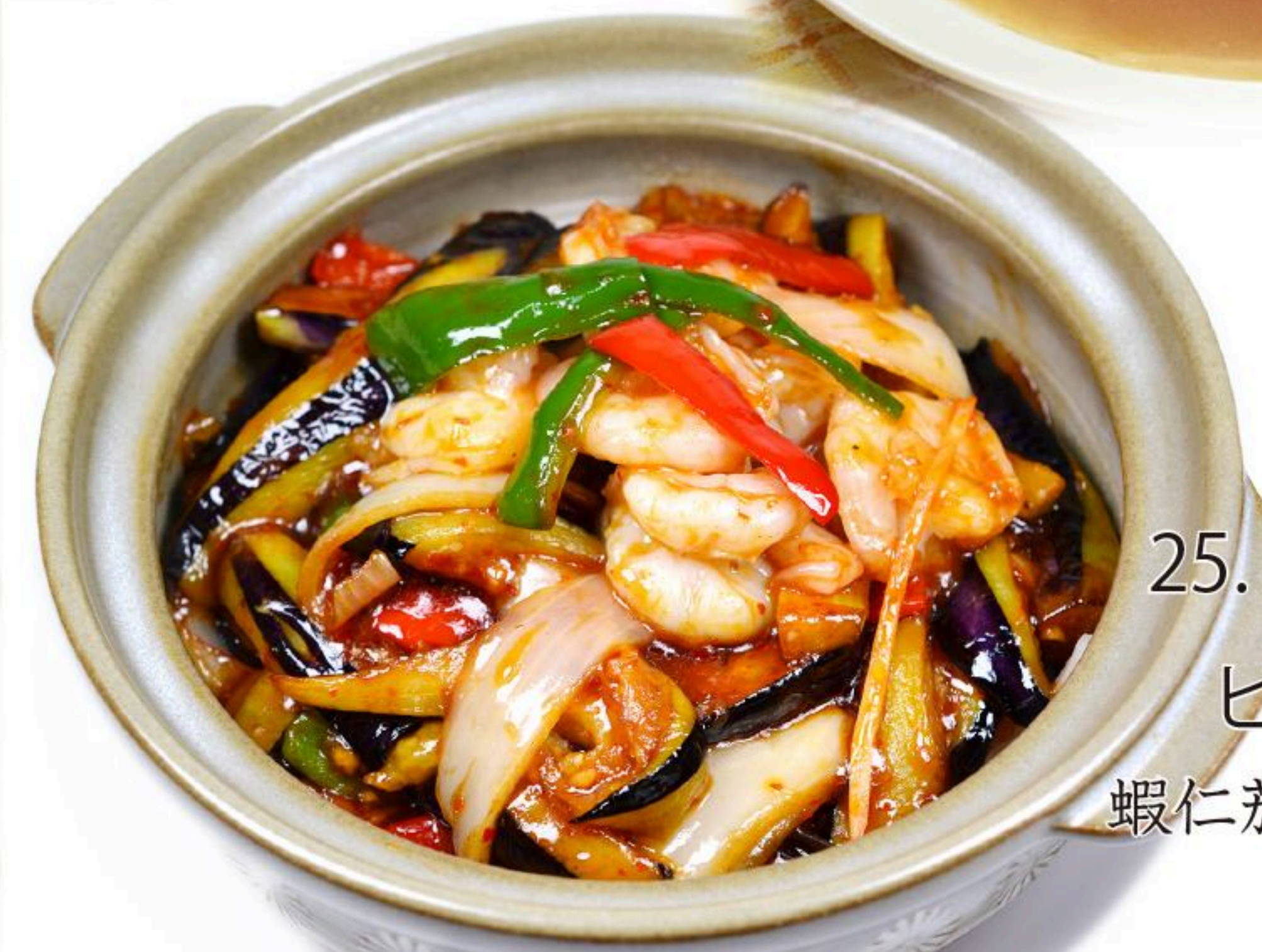
25. エビと茄子の ピリ辛土鍋 蝦仁茄子鍋 980円