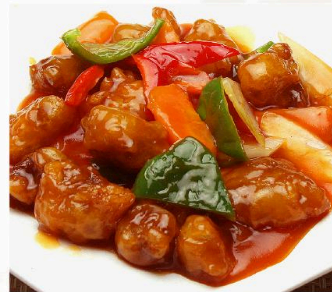
50.甘酢スブタ 古老肉 880円