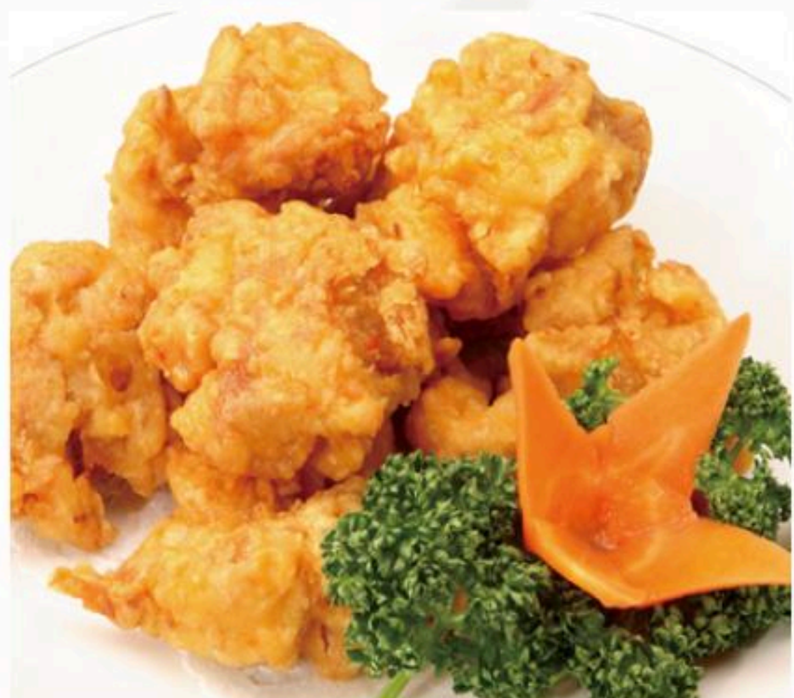
52.鶏の唐揚げ 炸鶏挾 780円