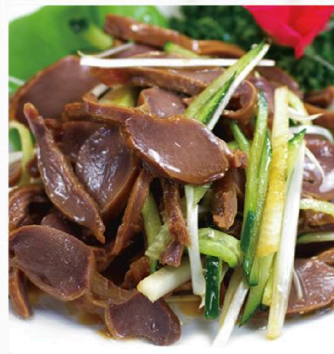
16. 砂肝の葱和え 葱油砂肝 400円