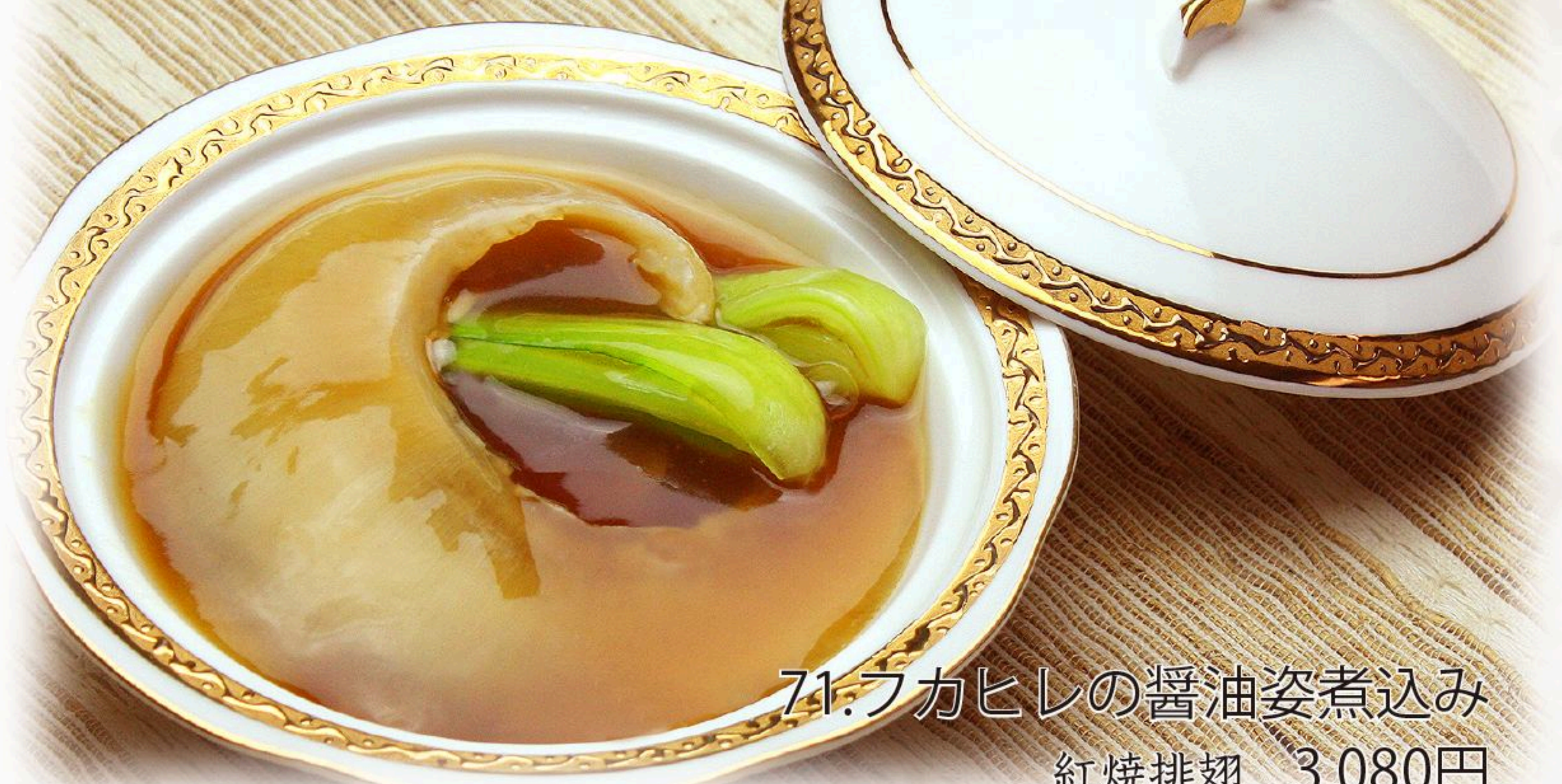
71.フカヒレの醤油姿煮込み 紅焼排翅 3,080円