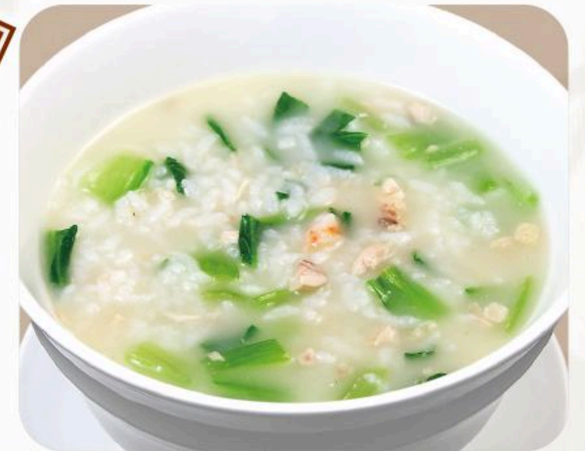
78.海鮮粥 海鮮粥 780円