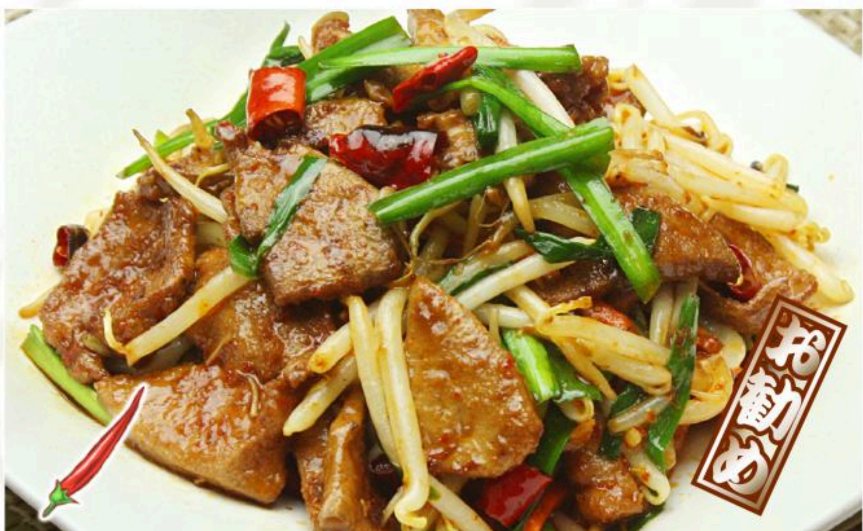
40.ニラレバーの四川風炒め 辣炒猪肝 880円