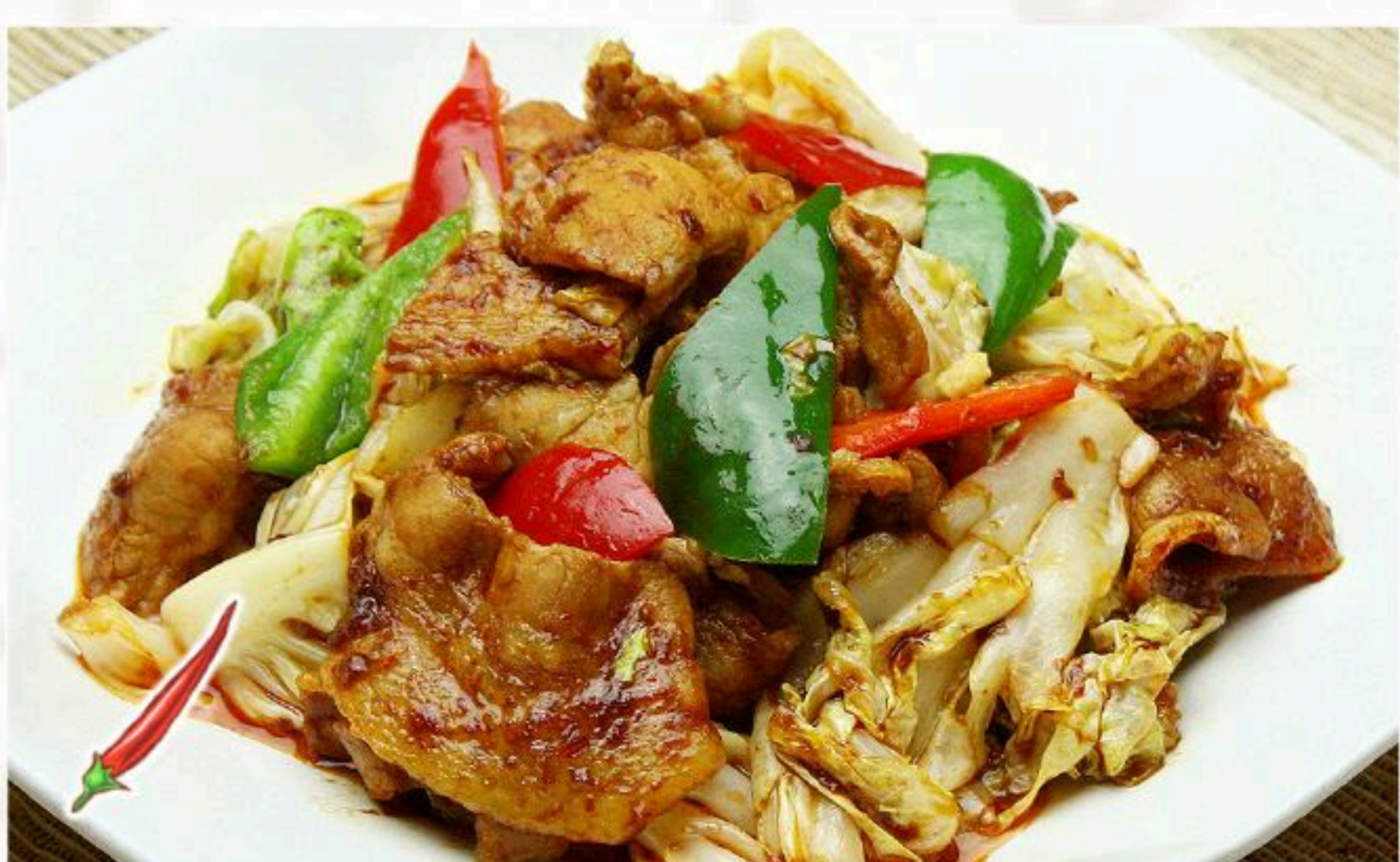
42.ホイコウロウ 回鍋肉 880円