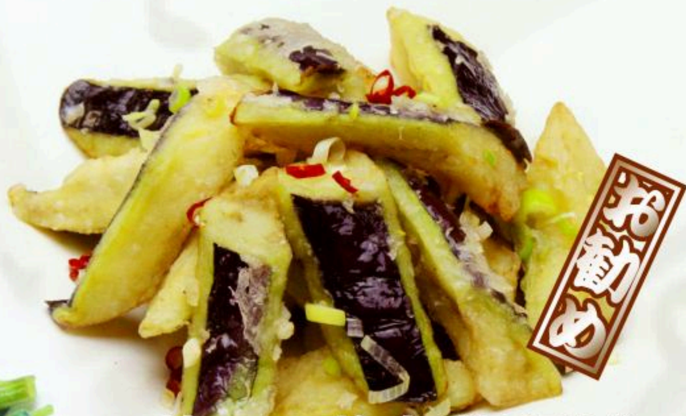
23. 茄子の塩胡椒揚げ 椒塩茄子 880円