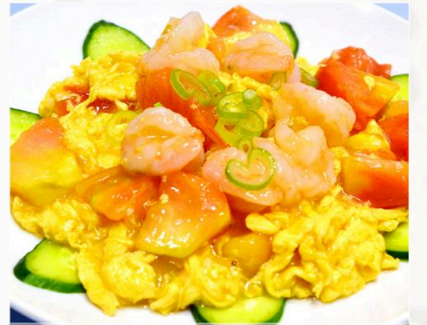
33. エビとトマトの玉子炒め 番茄炒蝦 880円