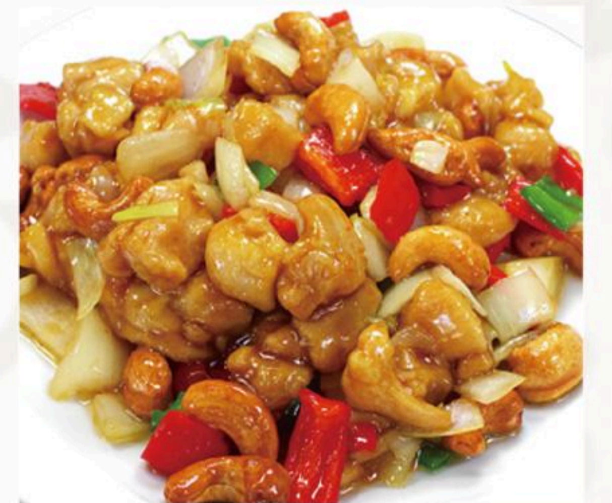
51.鶏肉と カシューナッツ炒め 腰果鶏丁 880円