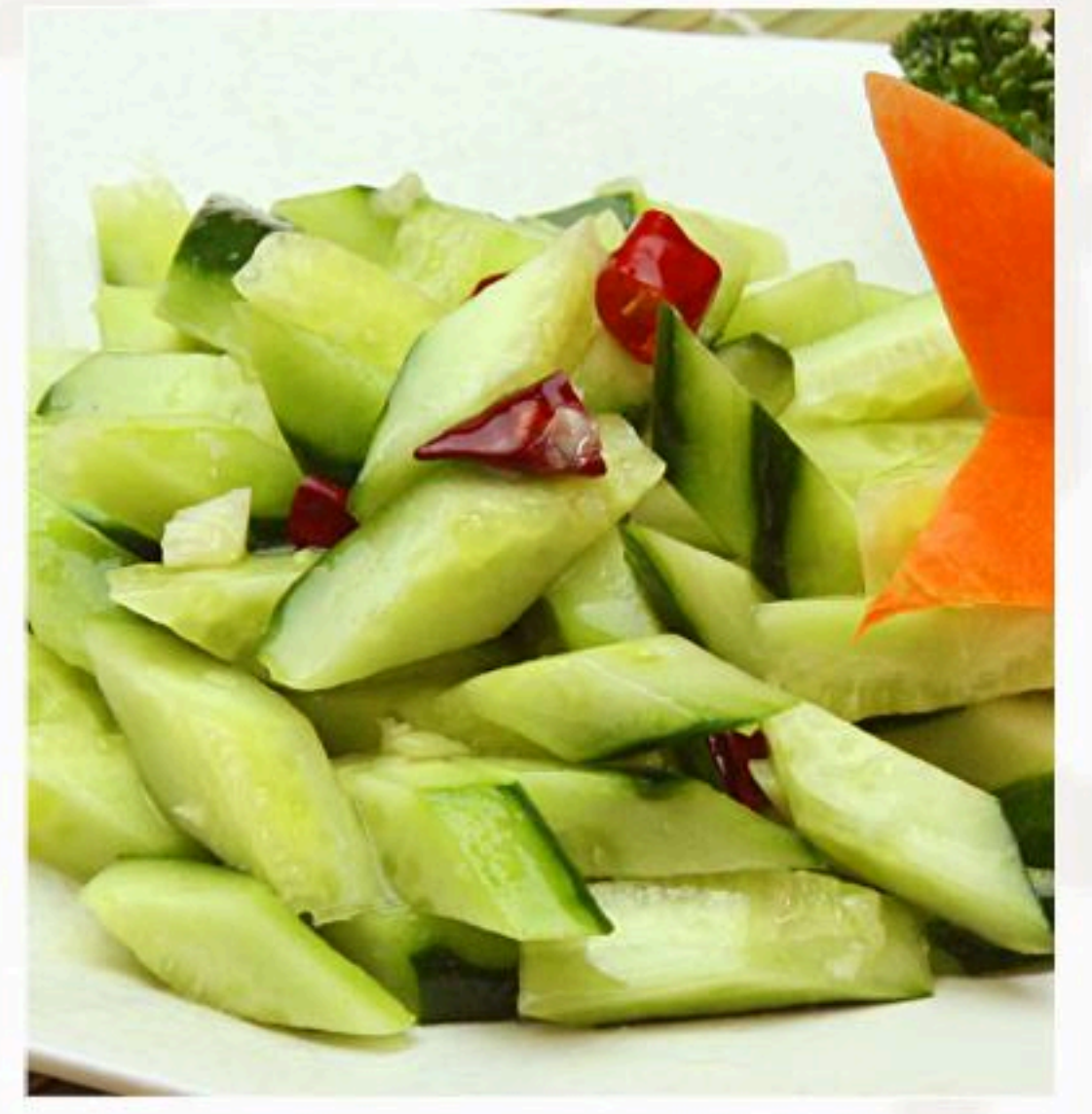
8. きゅうりのニンニク 和え 拌黄瓜 400円