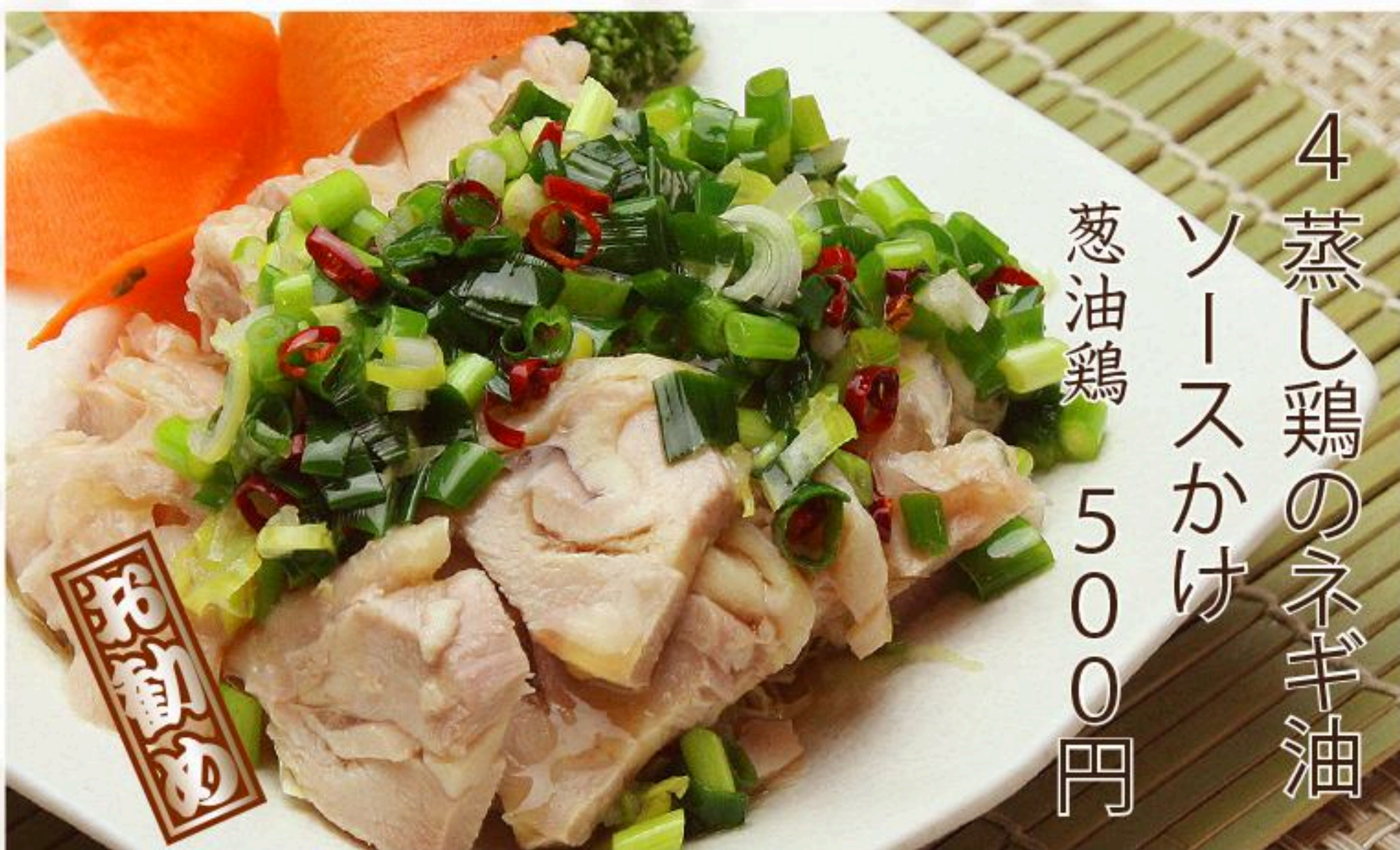
4 蒸し鶏のネギ油 ソースかけ 葱油鶏 500円