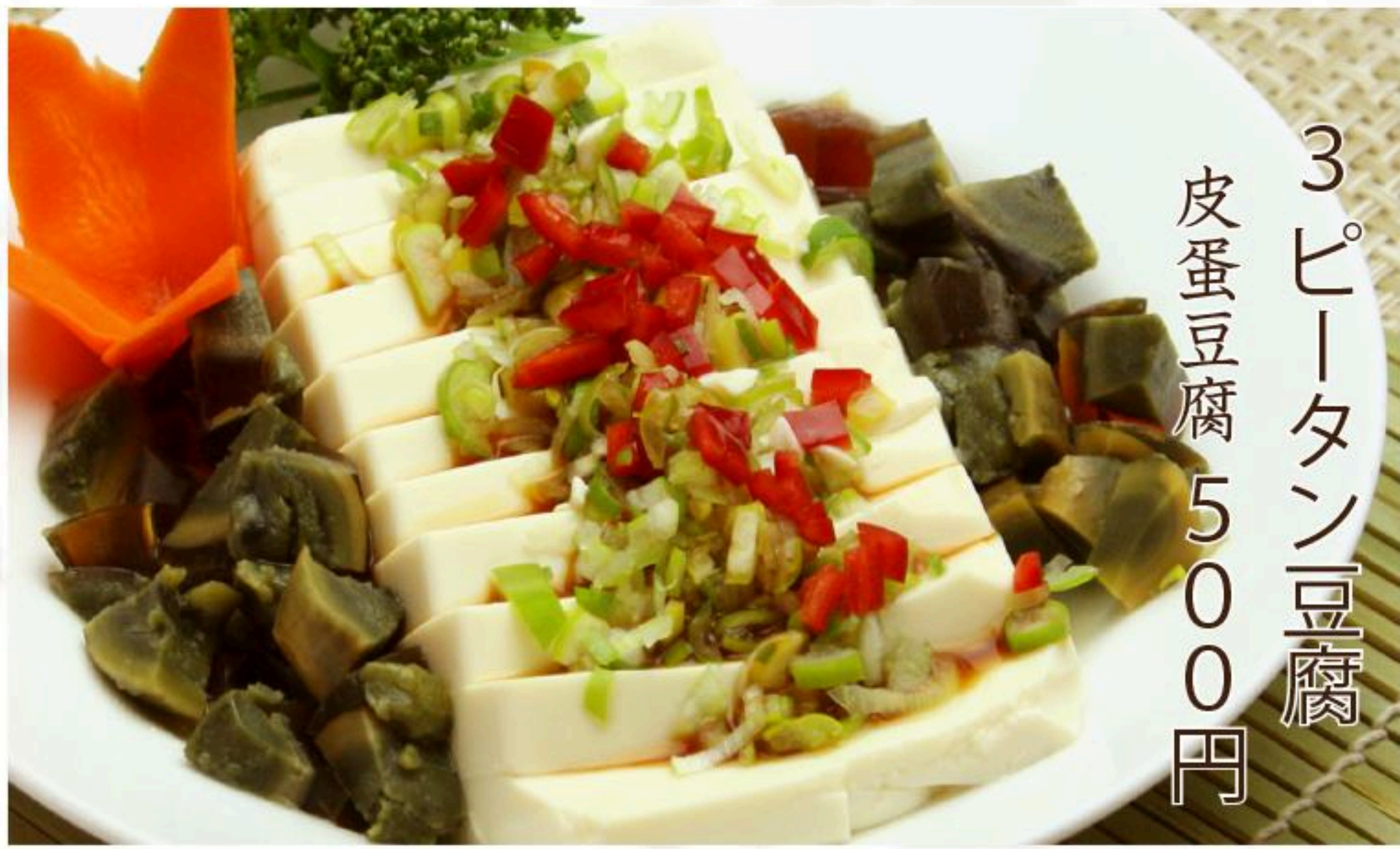
3 ピータン豆腐 皮蛋豆腐 500円