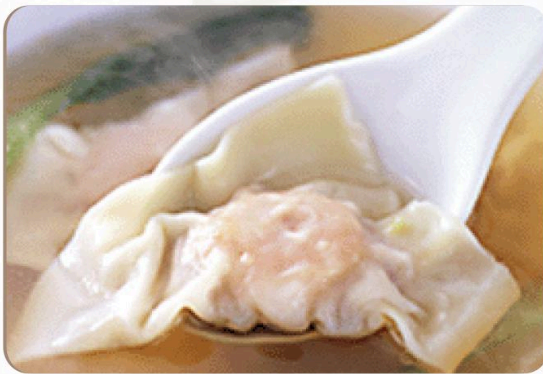
80.ワンタンスープ 餛飩湯 680円