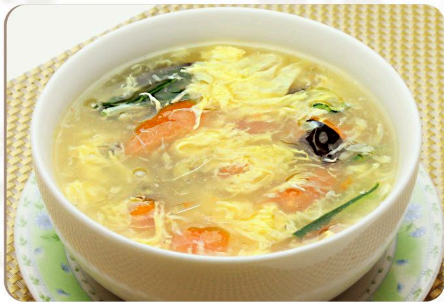
79.玉子スープ 玉子湯 580円