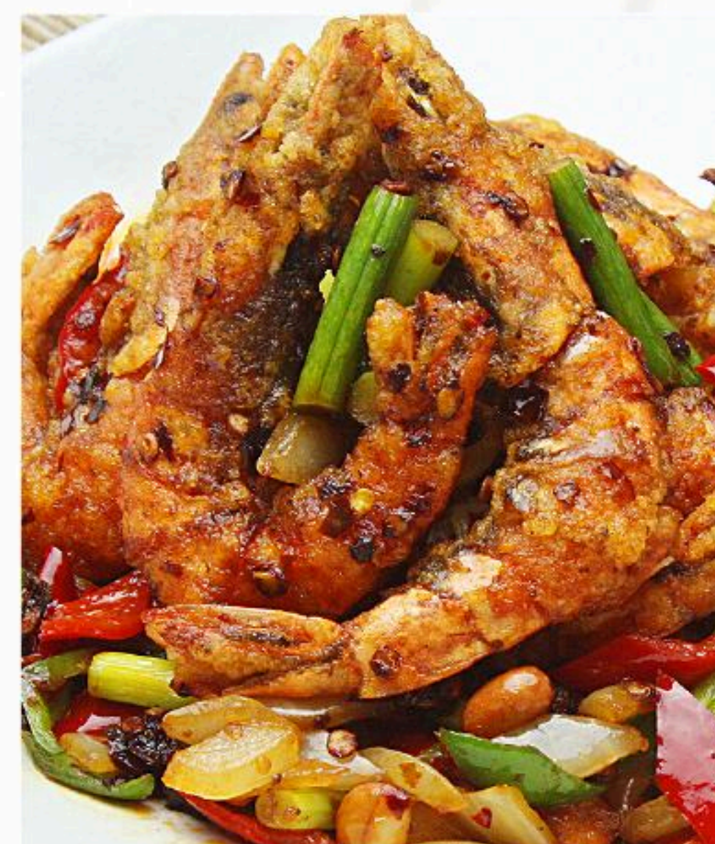
67.車エビの四川風 香り辛味炒め (6匹) 香辣蝦 1,180円