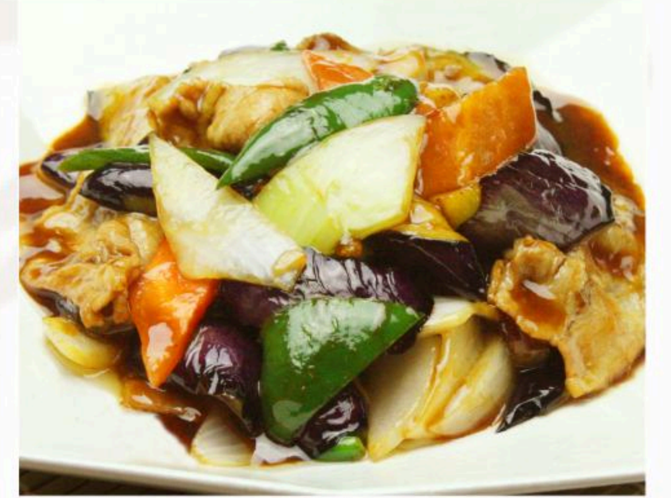
29. 豚肉と茄子の炒め 蠔油茄子 880円