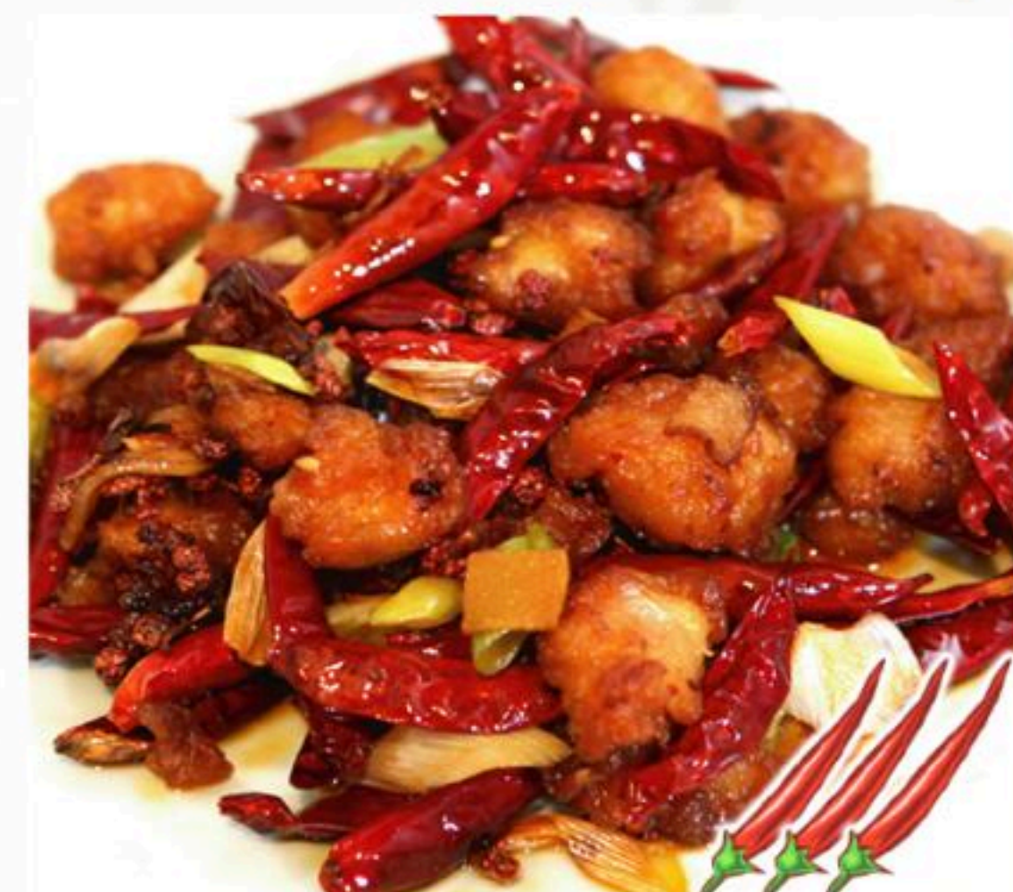
53.鶏肉の唐辛子炒め 辣炒鶏丁 880円