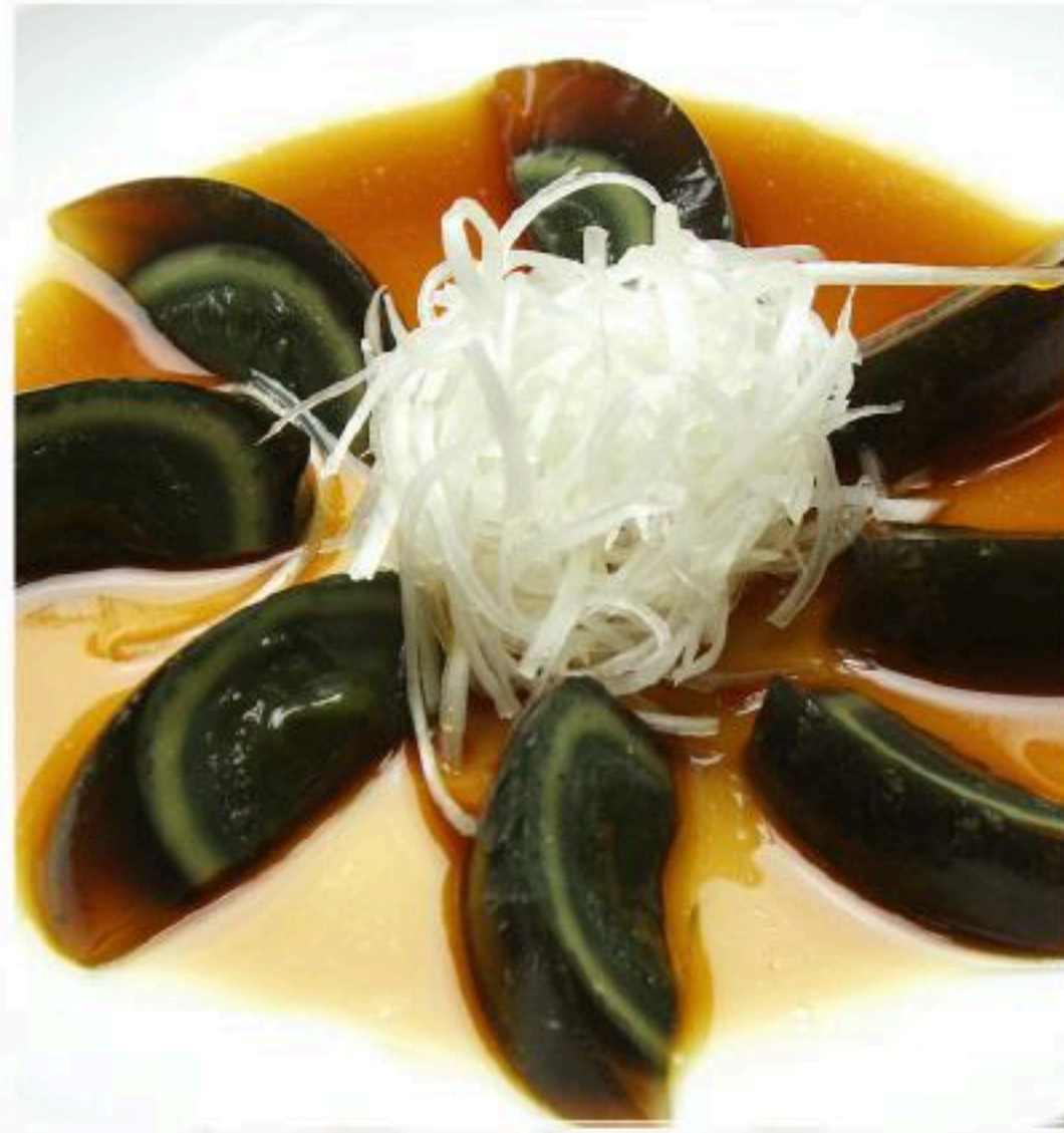
12. ピータン 皮蛋 400円