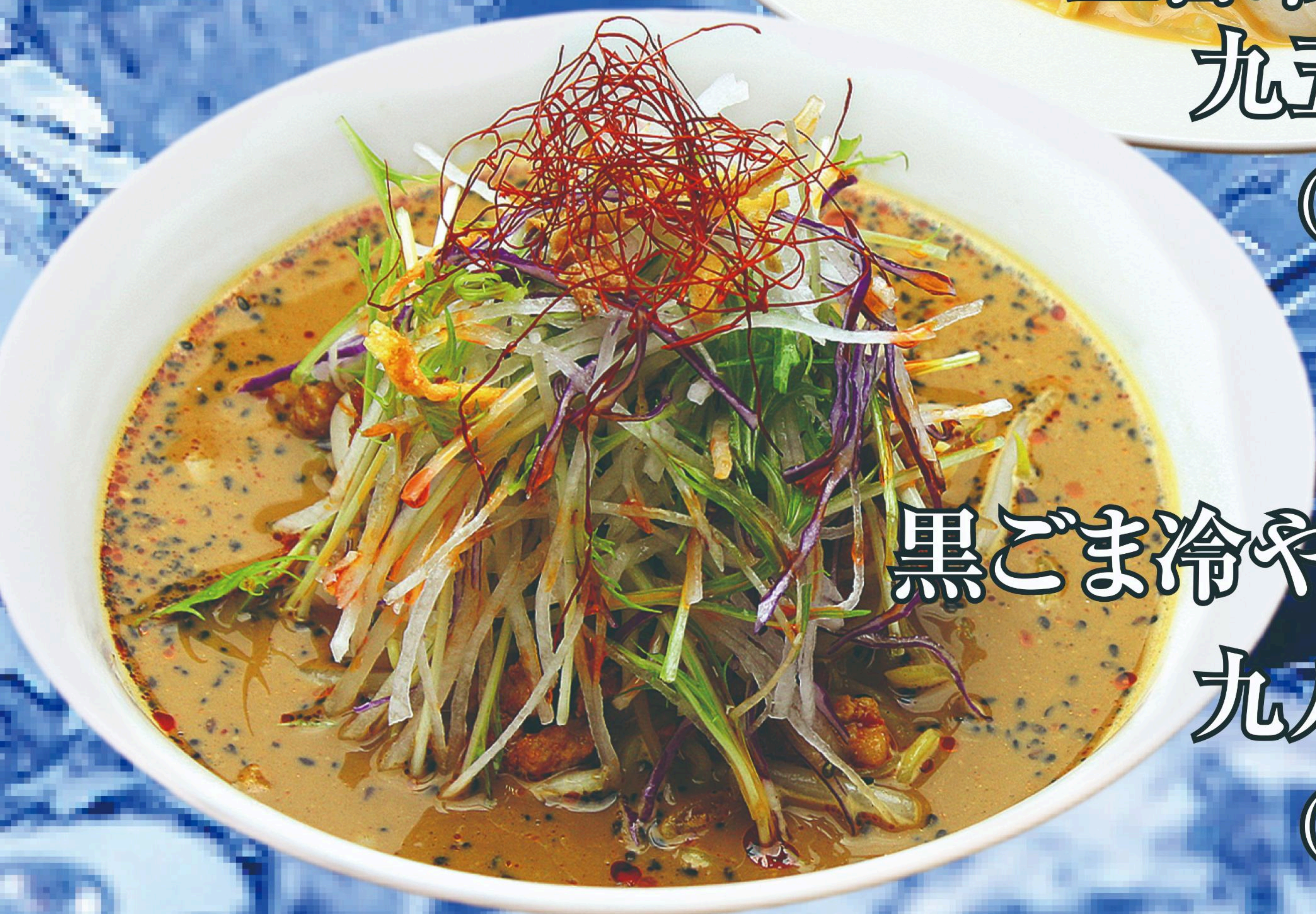
黒ごま冷やし坦々麺