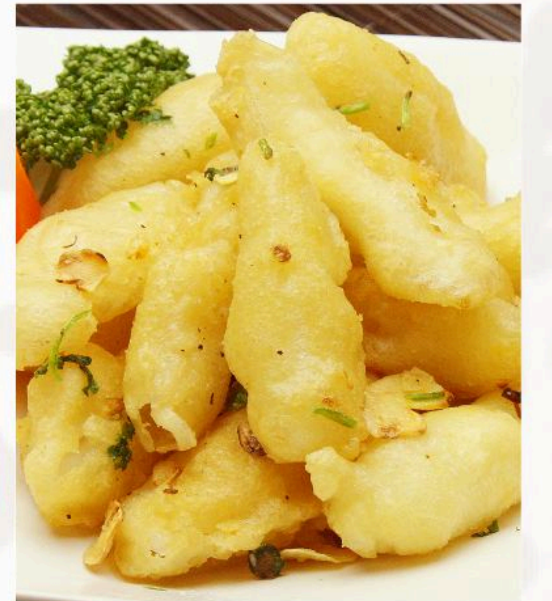
64.イカの塩胡椒揚げ 椒塩尤魚 980円