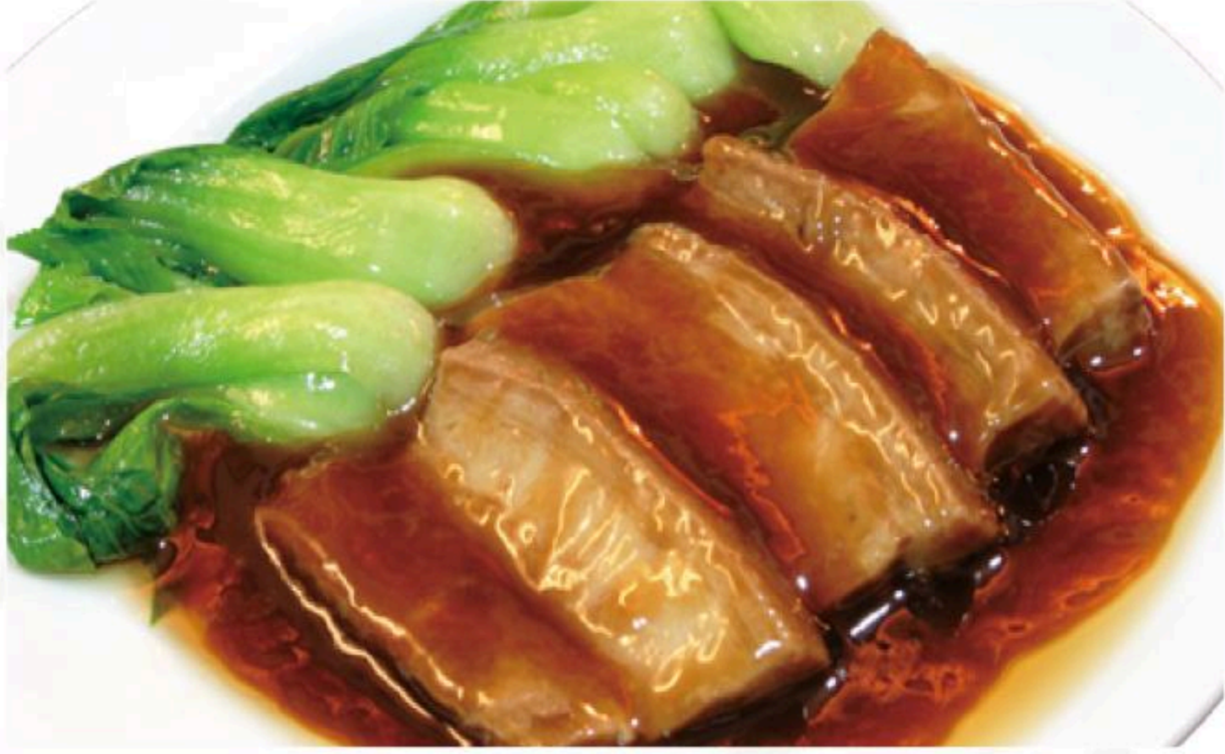
38.豚角煮 扣肉 980円