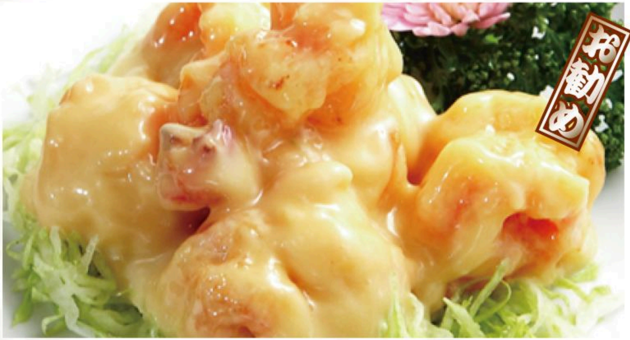
58.エビのマヨネーズ和え 沙律蝦球 980円