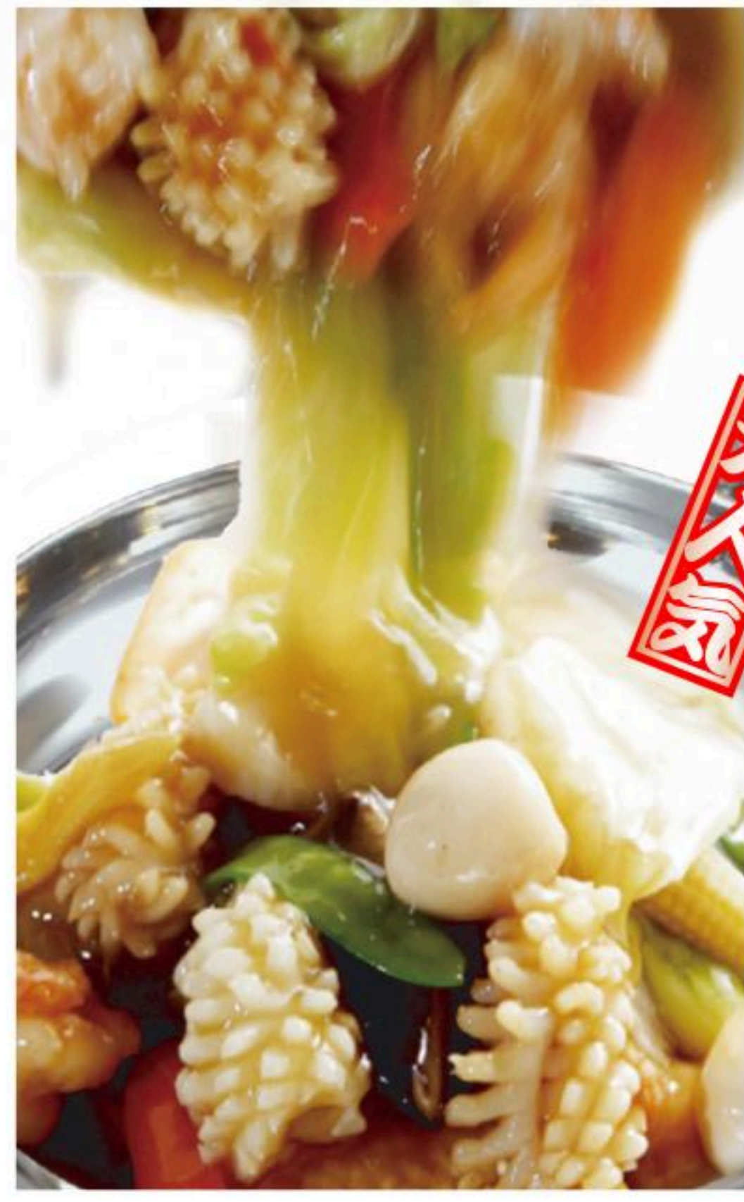
72.五目おこげ 五目鍋巴 980円