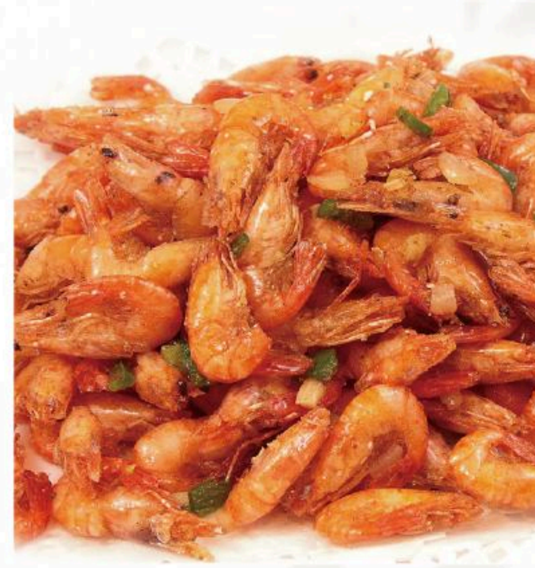
10. 揚げ川エビ 炸河蝦 500円