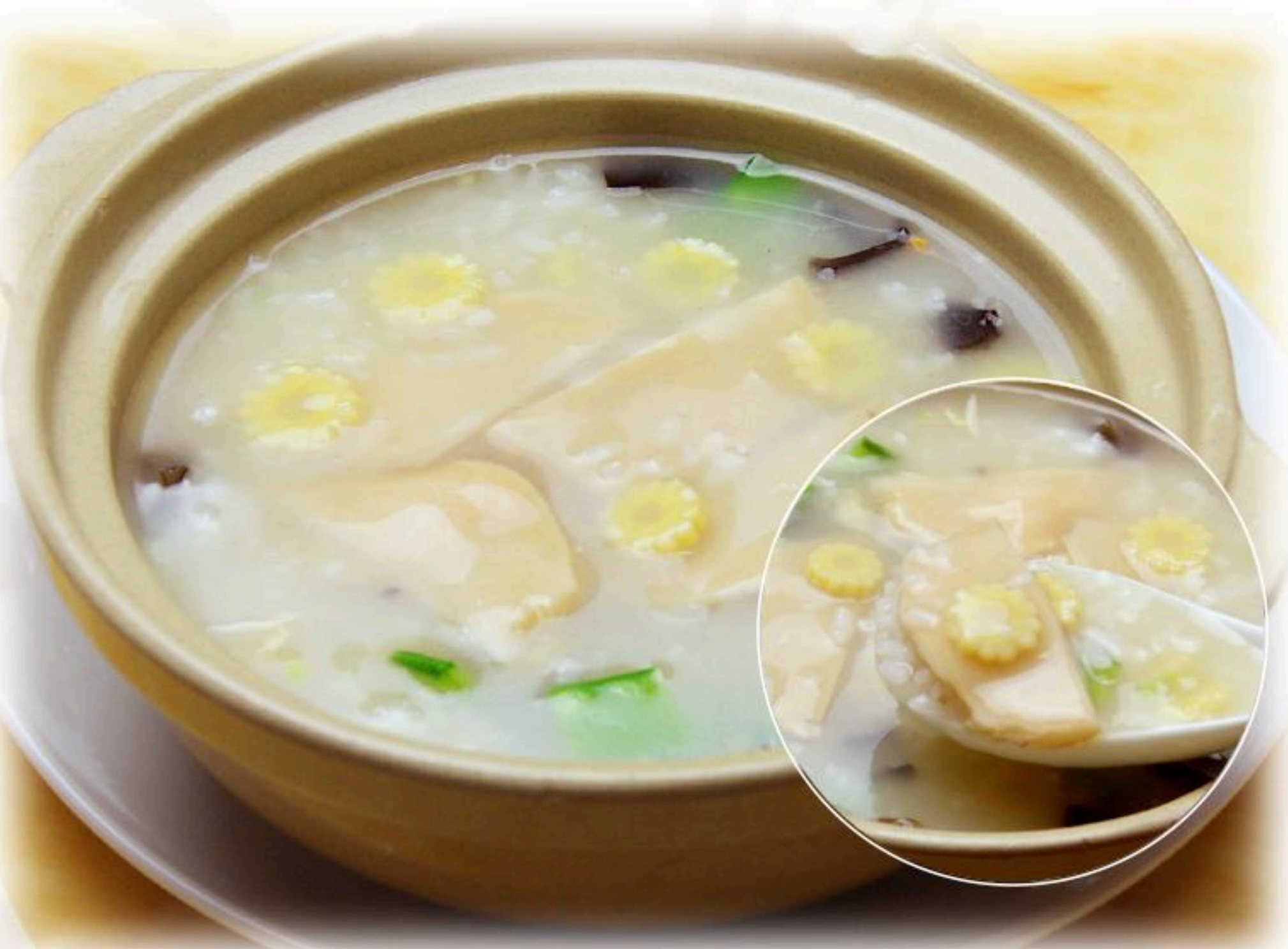
75.アワビ粥 鮑魚粥 1,080円