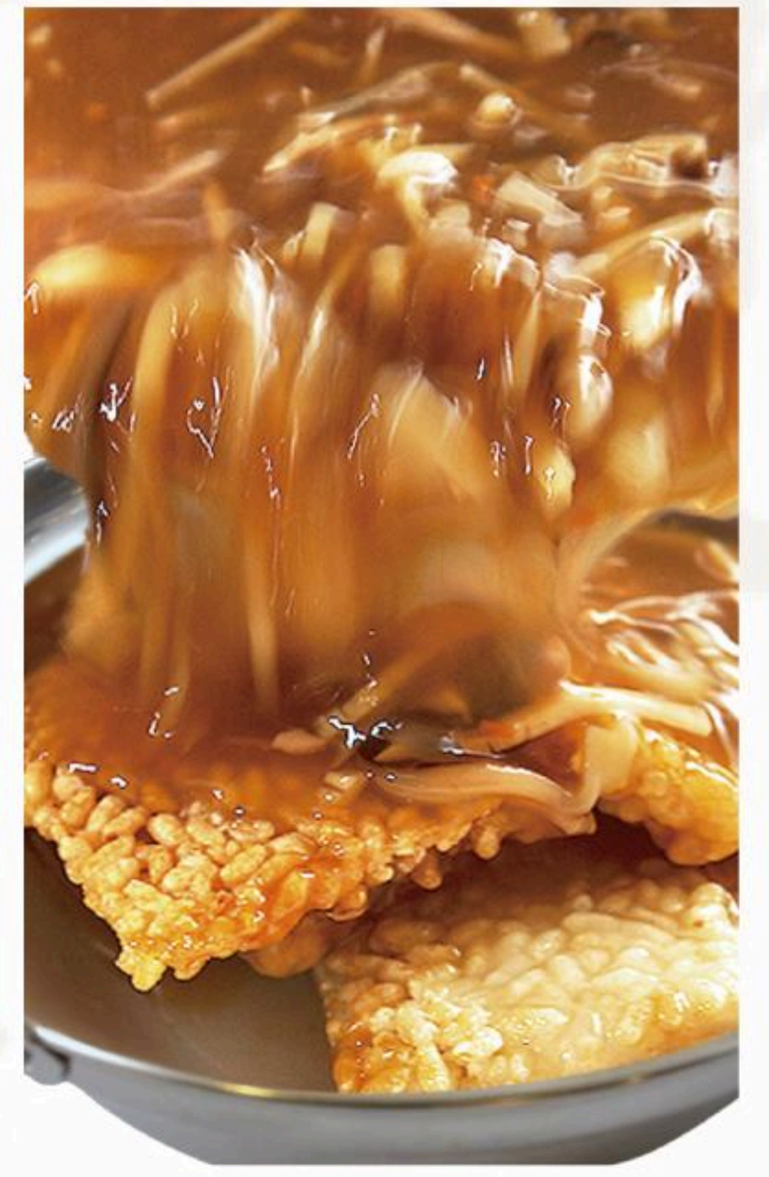
74.フカヒレおこげ 魚翅鍋巴 1,280円