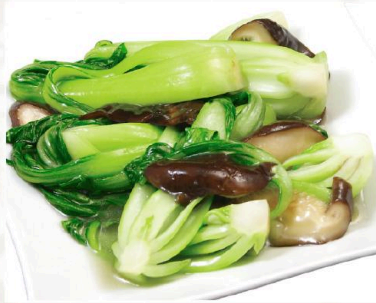
32. 青梗菜とキノコ 炒め 炒青梗菜 880円