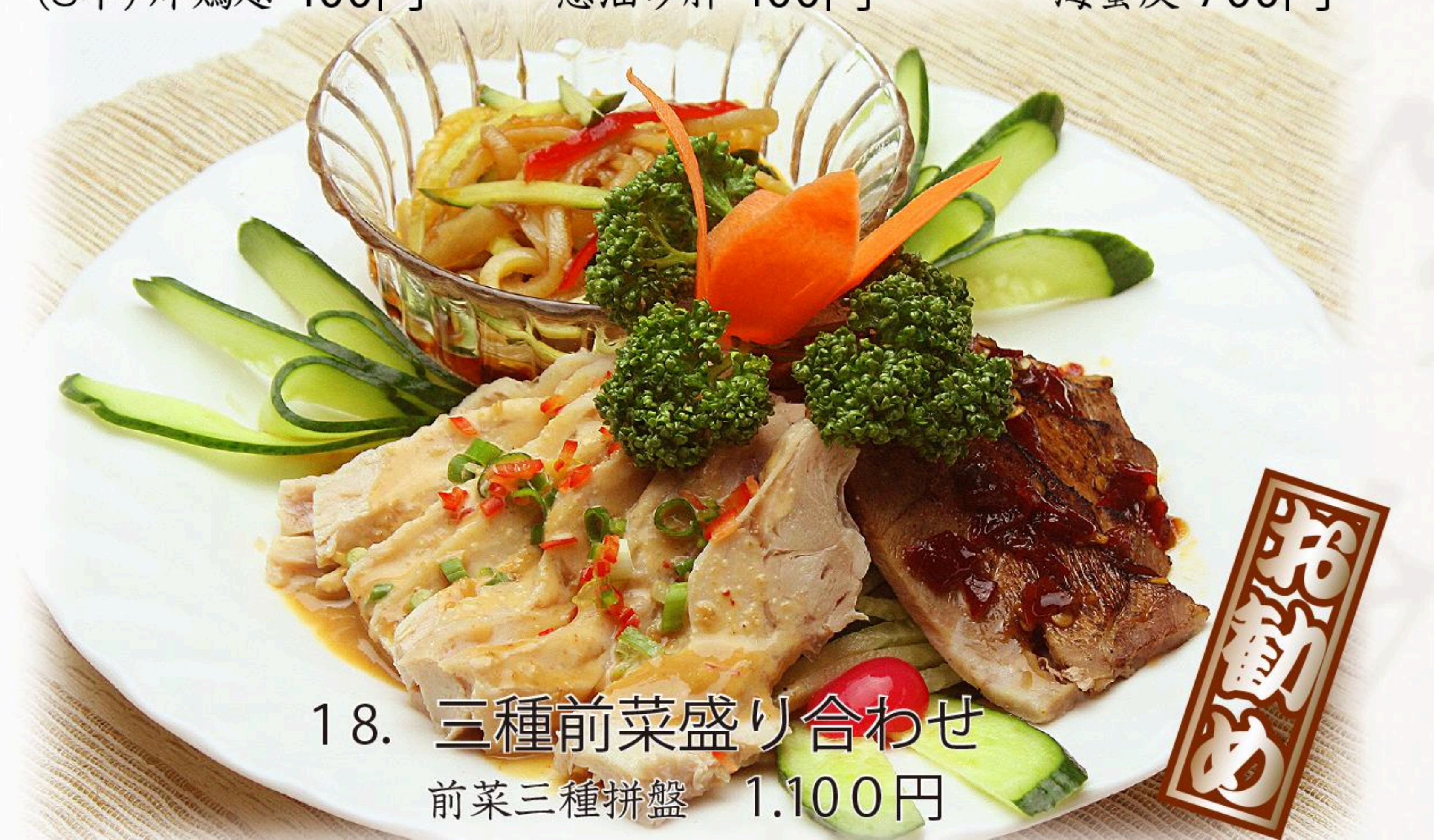
18. 三種前菜盛り合わせ 前菜三種拼盤 1.100円