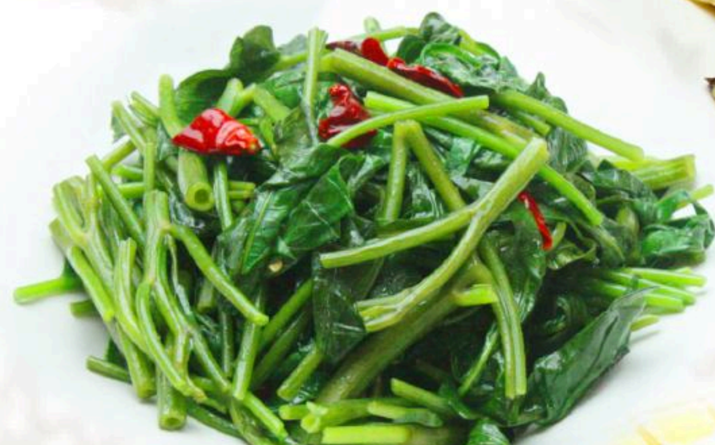
22. 空心菜炒め 炒空心菜 1,080円