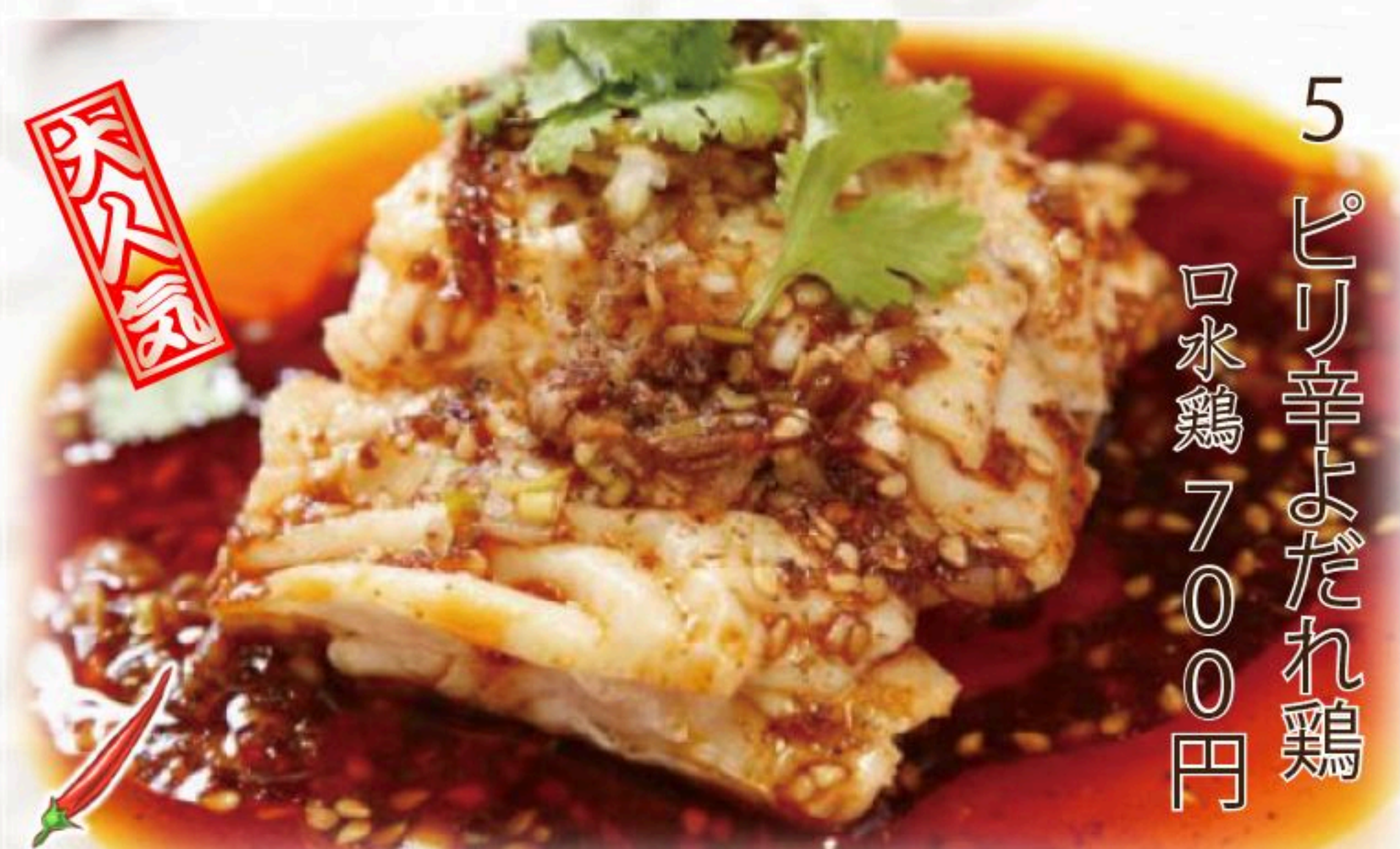
5 ピリ辛よだれ鶏 口水鶏 700円