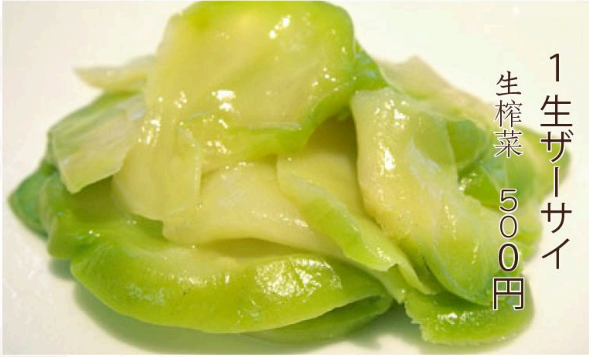
1 生ザーサイ 生榨菜 500円