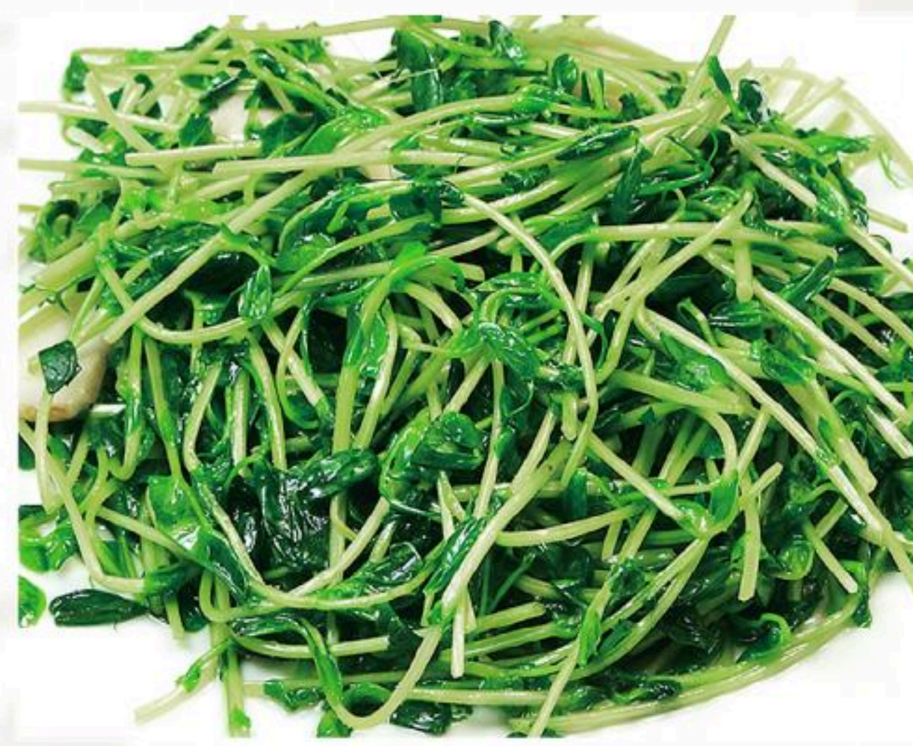
26. 豆苗炒め 炒豆苗 880円