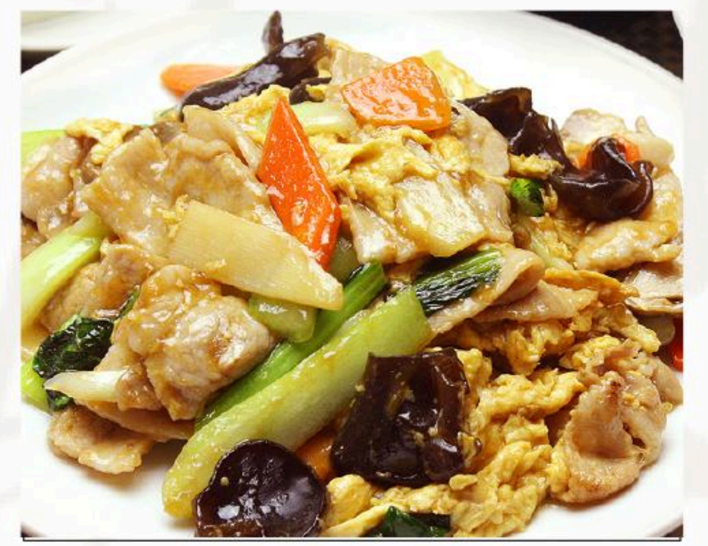
27. 豚肉とキクラゲの玉子炒め 木須肉 880円