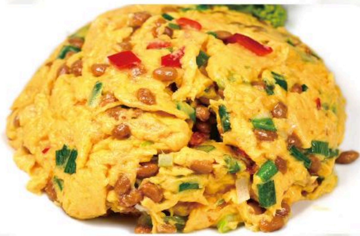
20. 納豆と玉子炒め 納豆炒蛋 680円