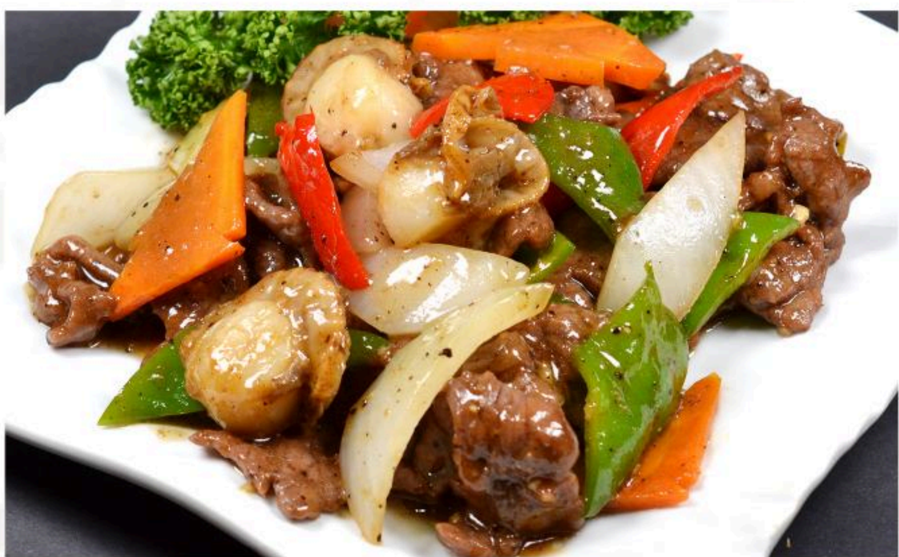
39.牛肉とホタテの黒胡椒炒め 牛肉炒干貝 1,080円