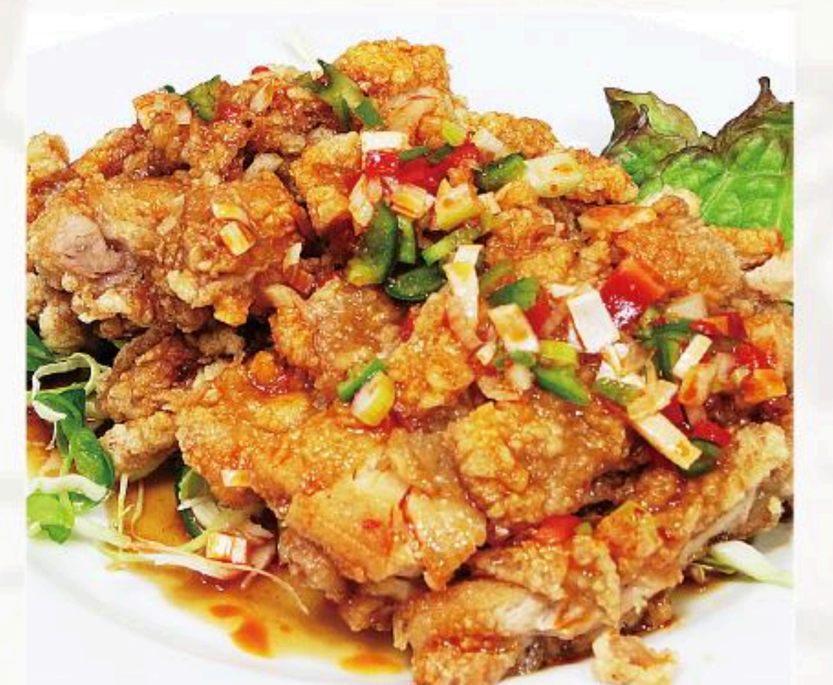
54.鶏肉の特製ソース かけ 油淋鶏 880円